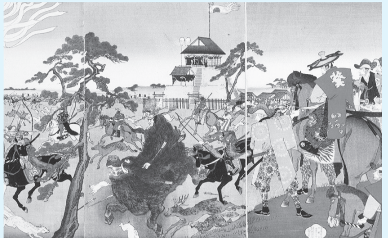
将軍家於小金原御鹿狩之図

秋の企画展「松戸と徳川将軍の御鹿狩」では、古文書・絵図・浮世絵、日本在来馬やシカ・イノシシなどの剥製、弓矢や火縄銃などの武具も展示し、4回行われた徳川将軍の御鹿狩について考えます。どうぞご期待ください。