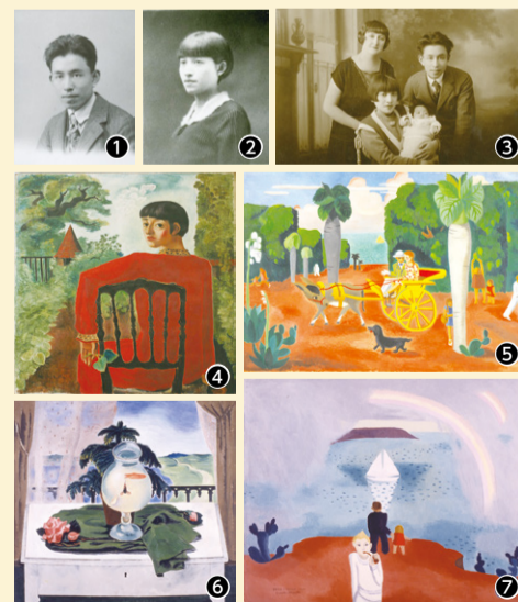
①鼎②須美子③左から2人目より須美子、長女、鼎(1928年)④板倉鼎《黒椅子による女》1928年⑤板倉須美子《午後 ベル・ホノルル12》1927~28年頃⑥板倉鼎《金魚と花》1927年頃⑦板倉須美子《ベル・ホノルル24》1928年頃 作品はいずれも松戸市教育委員会蔵