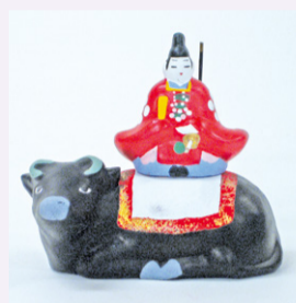
津山土人形・牛乗り天神(岡山県)