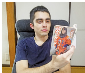
お家で集中、宇宙に夢中 Literarily (not literally) lost in space

自宅で過ごす時間が多いなら、時々読書で休憩してはいかがでしょうか。外で冒険する代わりに心の冒険をすることもお勧めします。