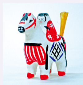
会津張子・馬(福島県)