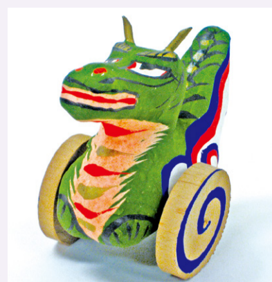
三春張子・竜車(福島県)