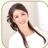
山本ミッシェルのぞみ氏

NHK国際放送局キャスター・山本ミッシェルのぞみ氏が、キャスターや国際会議の司会、英語やコミュニケーション学講師としての経験をもとに、学校・地域での多文化コミュニケーションのあり方について講演します。