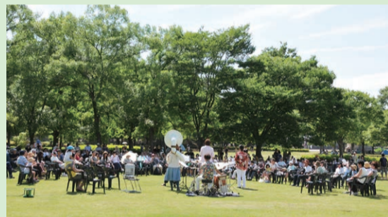
過去の開催時の様子