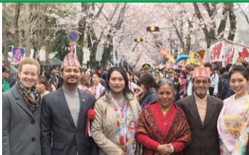
ネパール在日臨時代理大使・ラジュバンダリ氏(写真左から2人目)

その後も、松戸の魅力が体験できるようにと、各国代表をどんどん招待しています。今年1月、ルーマニアのオリンピック選手2人は七草マラソンに参加してくれました。2月には、ドミニカ共和国の臨時代理大使が