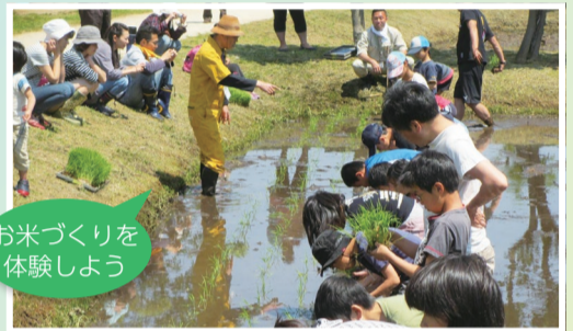
お米づくりを体験しよう

図4月10日 (金) [必着] までに、往復ハガキに住所・氏名 (ふりがな)・電話番号・学校名・学年・性別を記入して、〒270-2252 松戸市千駄堀 269 21世紀の森と広場パークセンター (☎ 345-8900) へ