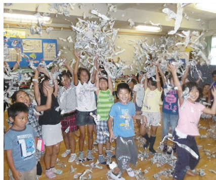
児童館では子どもが自由に遊べます