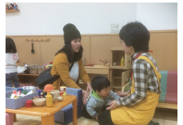
子育てコーディネーターに相談できます