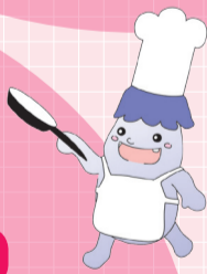
松戸市食育シンボル キャラクター 「ばくちゃん」