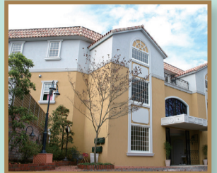
建築物・工作物部門 プチモンドハケ崎 カーサ・ディ・ドットーレ