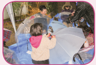
作った傘は持ち帰れます

上野東京ライン開業を記念して、JR東日本の忘れ物傘にペイントするアートイベント「JOBAN アートアンブレラ」への参加者を募集します。用意された傘とペイント用具を使って、思い思いの傘を作りませんか。東京藝術大学の学生によるライブペイントやチャリティーイベントなど、盛りだくさんです。