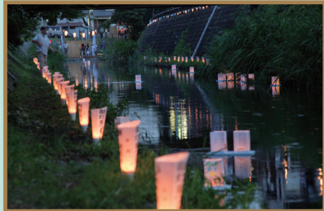
景観づくり活動部門 坂川とまちづくり市民の会