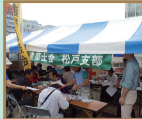
景観づくり活動部門 (一社)千葉県建築士会 松戸支部