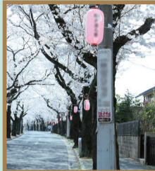
景観づくり活動部門 常盤平さくら通りの景観に配慮した電柱広告制作活動