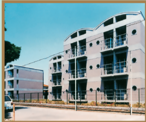
建築物・工作物部門 東京藝術大学 国際交流会館(新松戸)