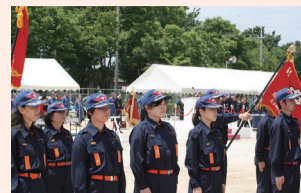
男女問わず活動しています

消火訓練や救出救護訓練を行い、専門的な知識と技術を養うことで、災害活動力を高めています。