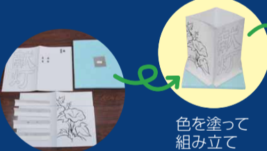
色を塗って組み立て