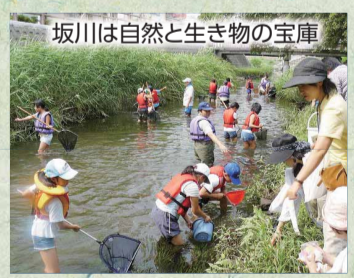
坂川は自然と生き物の宝庫

昭和30年代から急速に進んだ都市化により、坂川の水質は著しく悪化していました。水道水源である江戸川の水質にも悪影響を及ぼし、水道水の異常な臭味は社会問題となっていました。