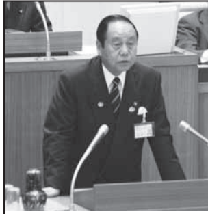
平成22年松戸市議会6月定例会にて

6月13日の市長選挙結果を受け、7月2日をもって退任することとなりました。四期十六年にわたり、ご支援・ご協力をいただきました市民の皆さまに深く感謝いたします。 私が市長に初当選した平成6年は、バブルが崩壊し、松戸市も例外なく切迫した財政状態の、まさに