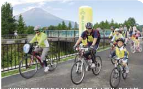
2009年に開催されたMt.FUJIエコサイクリングの様

秋のお彼岸のころ、祖光院の境内の林は燃えるような赤の彼岸花で埋めつくされます。市内でこれほどの彼岸花(曼珠紗華)が咲く場所はないでしょう。彼岸花の群生地は全国各地にあります。ここ祖光院も引けをとらず見事に咲いていました。(井出 勇さん)