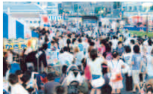
みんなで、でかけませんか

地元商店街と地域の団体が連携して、「矢切ビールまつり」を開催します。さまざまなイベント・模擬店をお楽しみください。 ※駐車場・駐輪場はありません。 図同まつり実行委員会・芝内 ☎090・2733・8854