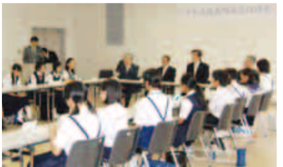
7月11日に行われた平和大使結団式で決意表明する中学生たち