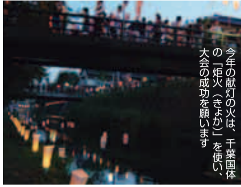
今年の献灯の火は、千葉団体の「炬火(きまか)」を使い、大会の成功を願います

水とともに生きた街「松戸宿」に坂川を拓(ひら)いた先人たちの感謝を込めて、川辺に明かりをともします。昔懐かしい縁日の雰囲気をお楽しみください。 内容とうろう流し、とうもろこし市、縁日屋台、ステージイベント他 ※詳細はホームページ http://www.kentou.org/ 〒270-0362 松戸市 362・53356