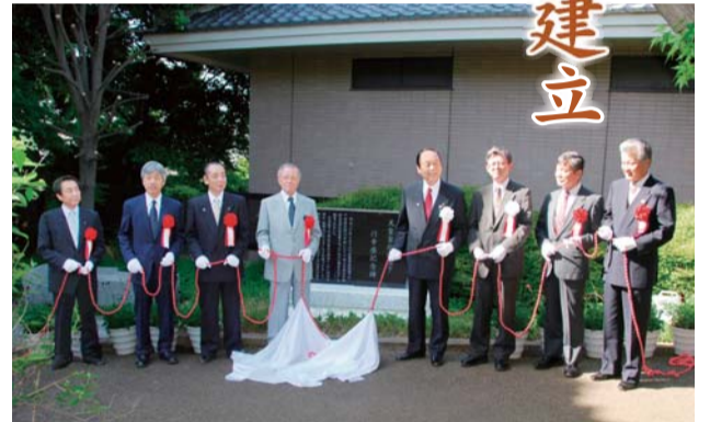
記念碑はともに、八柱霊園石材同業組合から寄附いただきました