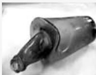
高熱で変形した瓶

原爆の被害を生々しく伝える被爆物品約50点を、長崎原爆資料館から借りて展示します。被爆した瓦に直接触ることができ、コーナーを設けるほか、広島・長崎の被災写真なども数多く展示します。また、戦中の市民生活を展示する松戸ゆかりのコーナーを設置します。ぜひご覧ください。