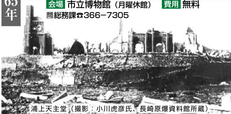
浦上天主堂

原爆の被害を生々しく伝える被爆物品約50点を、長崎原爆資料館から借りて展示します。被爆した瓦に直接触ることができ、コーナーを設けるほか、広島・長崎の被災写真なども数多く展示します。また、戦中の市民生活を展示する松戸ゆかりのコーナーを設置します。ぜひご覧ください。