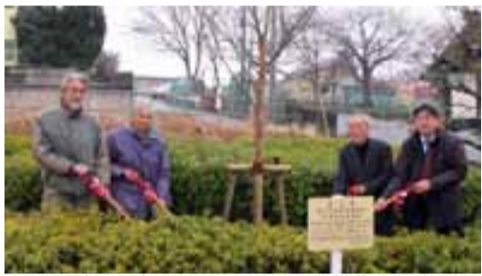
発足10周年を記念してエノキを植える緑推進委員の皆さん

2月15日に国道六号線沿いの「水戸街道一里塚」(八ヶ崎)で、かつて旅人の目印としてこの地に植えられていたというエノキが、緑推進委員会によって植樹されました。 緑推進委員会は学識経験者・市民・行政等が一体となって緑の保全と推進を図るために設置され、発足10周年を迎える記念として今回の植樹が行われました。 今後も一人ひとりが力を合わせ、松戸の緑化に取り組んでいきたいと思います。