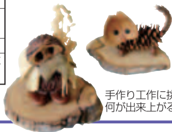
手作り工作に挑戦! 何が出来るかな?