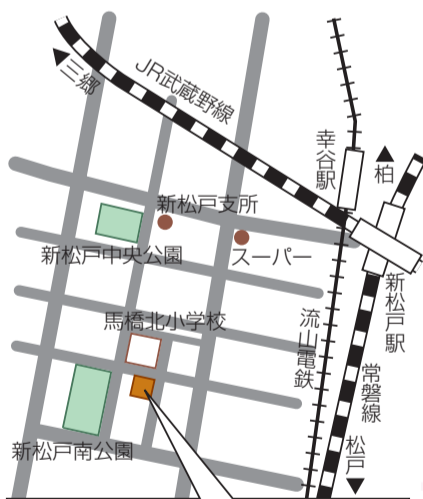
青少年会館 (JR新松戸駅から徒歩15分) お車での来場は、ご遠慮ください。

※プログラムは変更になる場合があります。 ※各団体が出店する模擬店でもお楽しみいただけます(売り切れ次第終了)。