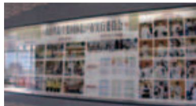
松戸市では、自転車(トラックレース)とフェンシング競技が開催されます。応援をお願いします!

松戸駅東西連絡通路内ギャラリーに、ゆめ半島千葉国体のコーナーを設置しました。現在は、第62回全日本フェンシング選手権大会(ゆめ半島千葉国体フェンシング競技リハーサル大会)の写真を展示しています。今後も、9月25日から開催されるゆめ半島千葉国体に関連したイベントの写真等を、12月まで展示する予定です。 園国体推進事務局 ☎330-0575