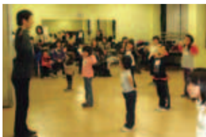
ダンスの練習にも力が入ります