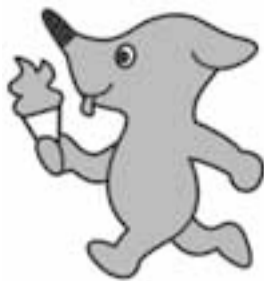
ゆめ半島千葉国体マスコットキャラクター「チーバくん」

炬火とは、「たいまつ」のことで、オリンピックの聖火にあたります。9月から開催される「ゆめ半島千葉国体」の炬火イベントを、「緑と花のフェスティバル」で開催します。このイベントで採火される「炬火」の、夢と希望と松戸らしさにあふれる名称を募集します。