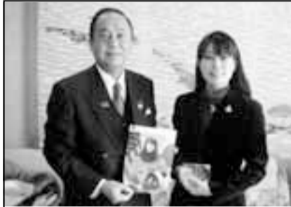
松戸に誕生した日本宇宙少年団「千葉スペースポイジャー分団」の結団式で山崎直子さんと

日差しの中に春の訪れを感じさせてくれる今日このごろ、各地から花の便りが聞かれるようになり、松戸の桜の開花も気になってきました。