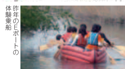
昨年のEポートの体験乗船