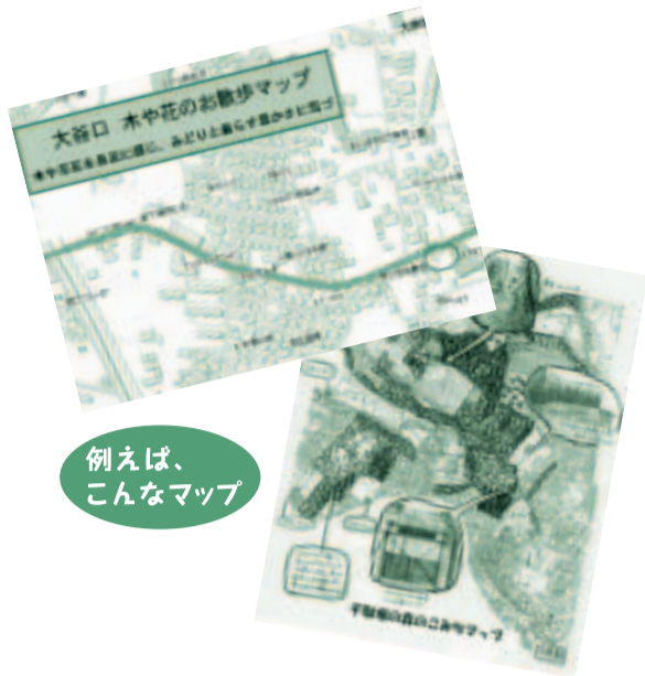
例えば、こんなマップ