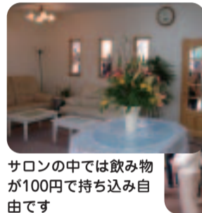
サロンの中では飲み物が100円で持ち込み自由です