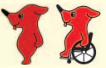
マスコットキャラクター「チーバくん」

ヨガ・健康体操教室 ①6/8(金)・29(金) 13:00~15:00 会場柿ノ木台公園体育館 ②6/9(土) 9:00~11:00 会場小金原体育館 ③6/20(水) 11:00~13:00 会場常盤平体育館 対象18歳以上の人 定員20人 費用1回400円 各開催日に直接各会場へ 園柿ノ木台公園体育館 ☎331-1131 第10回全国障害者スポーツ大会「愛称」が決定しました 愛称ゆめ半島千葉大会 スローガンゆめ半島 みんなが主役 花咲く笑顔 マスコットキャラクターゆめ半島千葉国体と共通のチーバくん 園第65回国民体育大会・第10回全国障害者スポーツ大会千葉県準備委員会事務局 ☎043-223-3095