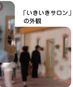
「いきいきサロン」の外観

供し、食べ物など持ち込み自由。常盤平団地自治会と団地地区社会福祉協議会が共同で、午前11時から午後6時まで、無休で運営しています。