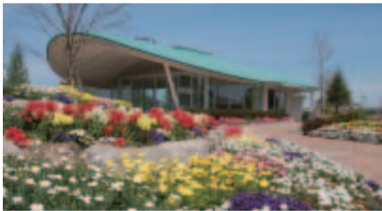
もくれんの花びらをイメージした公園管理センター