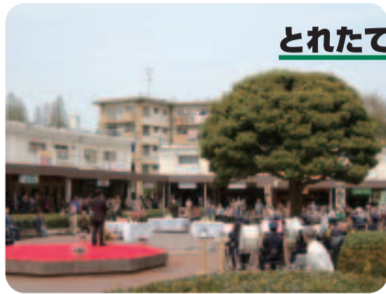
「あわせ広場」で行われたオープニングセレモニー