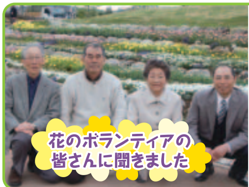
花のボランティアの皆さんに聞きました

花いっぱいの素晴らしい公園ができあがりました。小さなお子さんから高齢者まで集える場になるといいですね。また、花を育てるボランティア活動が、多くの人に広がり、市内が花でいっぱいになることを願っています。