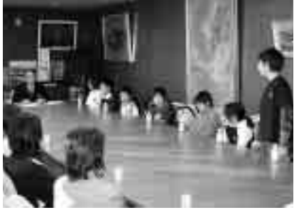
新松戸南小6年生の8人が市長室を訪れました

新年を迎え、はやひと月がたちましたが、北国では昨年から大寒波による豪雪の被害が多発しており、被災者の方々に対しては、お見舞い申し上げます。さて、昨年立ち上げた、もったいない運動 ワンスモ