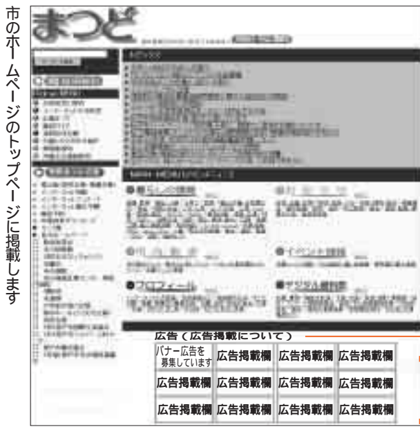
市のホームページのトップページに掲載します