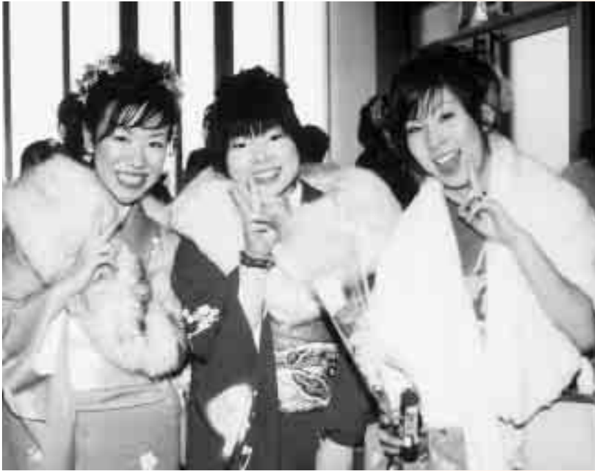
国民年金のスタートは20歳から！（1月9日に行われた成人式会場で）