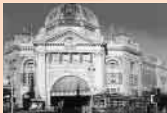
メルボルン フリンダース・ストリート駅

松戸市とホワイトホース市(旧ボックスヒル市)が姉妹都市の提携をして、今年で35周年を迎えます。これを記念して、市民訪問を実施します。これまでに、1,400人を超える市民が姉妹都市を訪れ、友情を育んでいます。5年前の姉妹都市提携30周年には、ホワイトホース市民の皆さんの訪問があり、松戸市民と交流を深めました。そして、今回の35周年には、ぜひ松戸市民の皆さんにお越しいただきたいのご招待を受けています。この機会に姉妹都市交流に参加してみませんか。