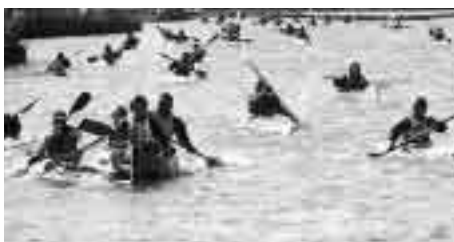
寒風を切り裂きながら、ゴールを目指す各艇

1月8日、松戸市カヌー協会による、「第24回松戸市長杯争奪クラブ対抗カヌー大会」が江戸川で行われました。競技は、性別、カヌーの種類や乗る人数等で分けられた全33種目。各種目が一斉にスタートし、全長5.5kmのコースを競い合いました。底冷えの寒さの中、本県を含む関東近県から集まった32チーム・約440人の参加者たちは、力強く水面を漕ぎ、ゴールを目指しました。