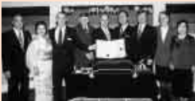
25周年には、市長・議長がホワイトホース市を訪問しました