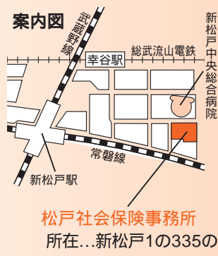
松戸社会保険事務所 所在...新松戸1の335の2

国民年金については、国民年金課 ☎ 366・7352 厚生年金、国民年金保険料・第3号被保険者、その他年金全般については、松戸社会保険事務所 ☎ 345・5525