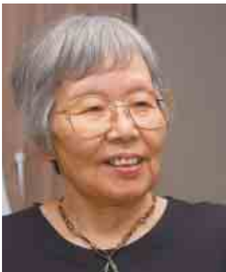
松戸朗読奉仕会会長