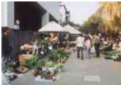
たくさんの植木や苗が販売されます