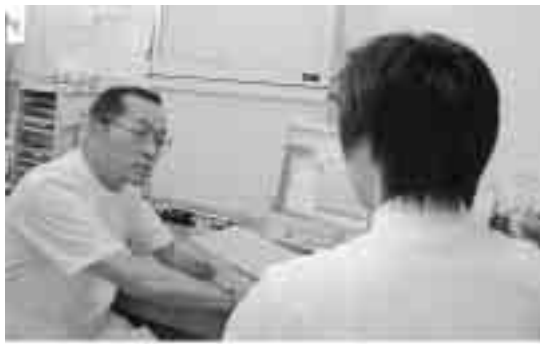
コンピューター画面を見ながら医師の説明が受けられます