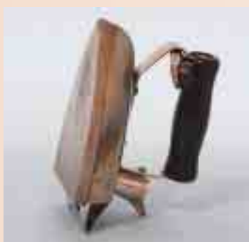
スーパーアイロン