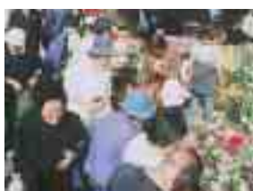
どれも新鮮な品ばかり

市民の食生活を支える卸売市場を身近に感じてもらうため、「市場まつり」を開催します。青果物・水産物などの即売と模擬店の出店などを企画しています。