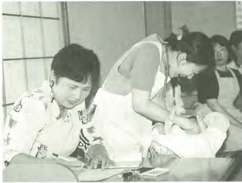
穂台市民センターで行われた育児教室。写真は、保健師(中央)が赤ちゃんの身体測定をし、健康推進員が母子健康手帳に身長や体重を記入しているところです

e-mail mcity@intership.ne.jp http://www.intership.ne.jp/matsudo/