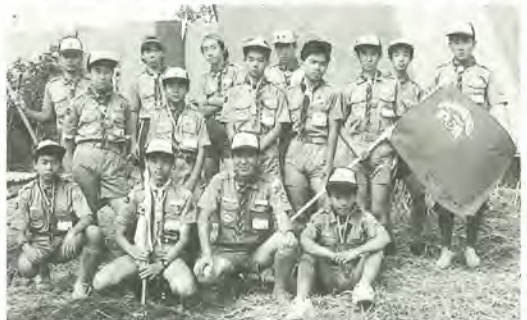
平成2年、妙高高原で行なわれた、ボーイスカウト日本ジャンボリーに参加 (前列右から2番目筆者)

最後に、わがままな私を支えてくれた妻に感謝するとともに、孫の誕生を夢見つつ、これから人生を歩んでいきたいと思っています。