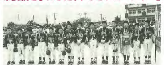
やなぎフューチャーの皆さん

10月20日から、市内33チームで争われてきた市長旗争奪・松戸市ジュニアソフトボール連盟大会。11月23日、新松戸西小学校で決勝戦が行われ、やなぎフューチャーが優勝しました。その他の結果は次のとおりです。 準優勝=しろあと子ども会 第3位=大金平つばさ子ども会、大畑ユニオン