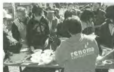
出来立ての鍋をとりわけました

●本庁(市役所地域振興課・広報課) 根本387-5 ☎366-1111 ●新松戸支所 新松戸3-27 ☎343-5111 ●矢切支所 三矢小台8-10-5 ☎362-3181