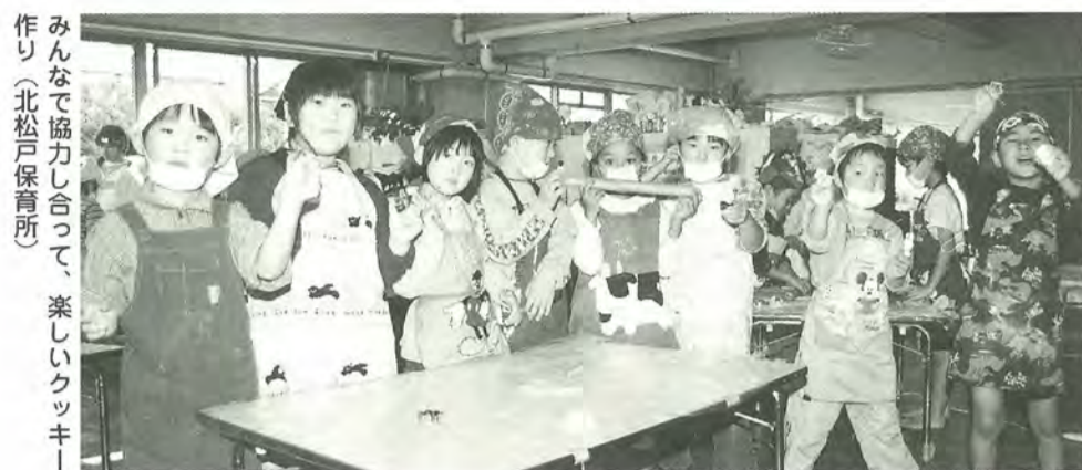
みんなで協力し合って、楽しいクッキー作り(北松戸保育園)