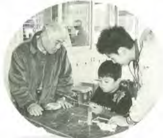
紙飛行機作りに挑戦

11月9日、小金南中学校で約八百人が参加して「三世代交流会」が行われました。この交流会は、地域の異なった世代の人たちと子どもたちがスポーツや物づくり、伝統文化や伝承遊びを通して、地域の一員としての強い自覚を高めてもらうと、小金南中学区青少年健全育成連絡協議会が主催したもので、今年で九回目を迎えました。