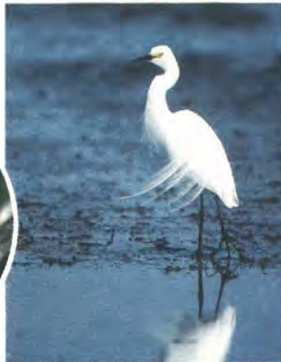
しらさぎ (水辺の鳥)

選定理由…森の豊かさを表わす代表的な鳥です。子どもから大人まで幅広く人気があります。