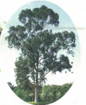
ユーカリ (国際交流の木)

選定理由…松戸では昔から風除けとして農家の屋敷周りに植えられてきました。市内には巨木も多く、市の保護樹木の指定もたくさんあります。