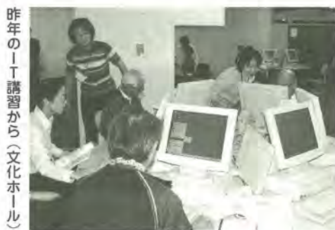
昨年のIT講習から(文化ホール)

平成13年度に開催したIT講習では、約1万4千人の皆さんに受講いただきました。今年度も引き続き、インターネットや電子メールなど、情報通信技術(IT)の基礎を学んでいただくために、「IT学習コーナー」を開設します。ITを上手に使いこなして、暮らしを便利にするために、ぜひご利用ください。 総務企画本部総務課 IT担当室 ☎366-7401