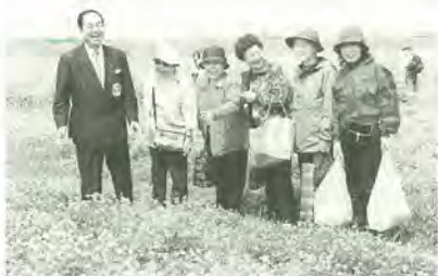
江戸川河川敷 レンゲ祭り (13日)

4月から新年度が始まり、市では、「IT担当室」、「ボランティア担当室」、「清流ルネッサンス担当室」と新たに三つの担当室を設置しました。今後、これらの担当室を中心として、「i-cityまつど」、「ボランティア推進都市まつど」、「緑花清流によるまつどの創生」を積極的に進めて参ります。