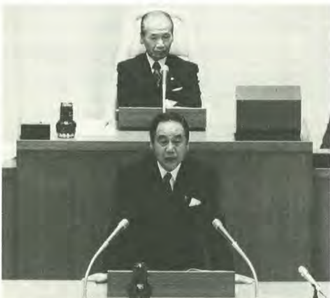
松戸市定例市議会にて施政方針を発表する市長

もう一つの大きな問題として、バブル経済崩壊後の十年にも及ぶ長い経済低迷が引き起こした、深刻な財政状況を挙げることが出来ます。私は、この「心の問題」と「財政の問題」という社会全体を覆っている難問を解決するために、特に三つの取り組みに意を注いでまいりたいと考えております。