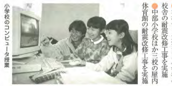
小学校のコンピュータ授業