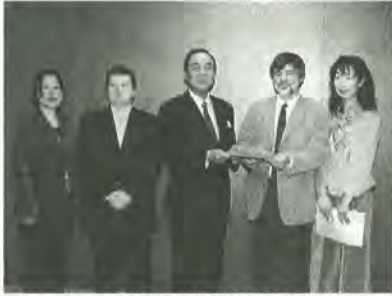
市長へ報告書が手渡されました

市内には、数多くの外国籍市民の方々が生活しています。平成14年3月1日現在、松戸市の人口は四十六万八千八百七十四人、うち外国人登録をされている方が七十三万七千八百八十二人と、およそ六十人に一人が外国籍市民ということになります。