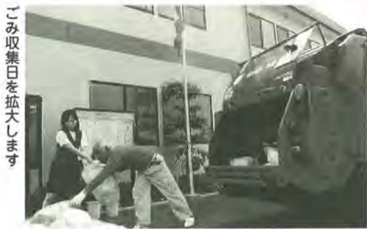
ごみ収集日を拡大します

花の中 国際交流 広がりぬ As cherry blossoms spread over the town, Links of exchange ripple to settle down Among the multinational therein.