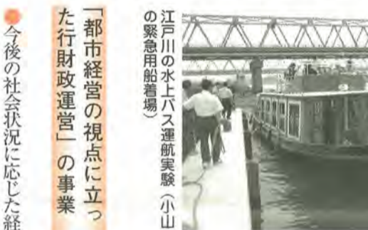
江戸川の水上市バス運航実験(小山の緊急用船着場)