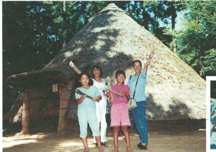
野外展示では、縄文時代の竪穴住居が3棟復元されています

皆さん、市立博物館に行ったことはありますか。 21世紀の森と広場の中、緑豊かな環境にあり、私たちの街の歴史を知るには、もってこいの場所です。 市立博物館では、松戸に人が住み始めた3万年前から1960年代の常盤平団地の誕生までを分かりやすく展示しています。また野外の縄文の森のなかには復元された竪穴住居があり、縄文時代の雰囲気満点です。 市民の皆さんに、より親しまれる博物館をめざして、たくさんの催しを用意しています。9月24日(休)までは、「松戸の歴史発掘」展を開催していますので、ぜひお出かけください。 市立博物館 ☎384-8181