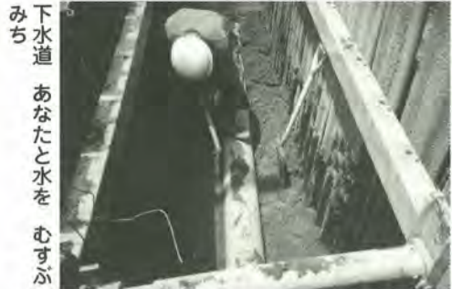
下水道 あなたと水を むすぶみち

今日、私たちが健康で快適な生活をするためには、下水道はなくてはならないものになっていきます。9月10日は第41回下水道の日です。この機会にもう一度下水道について考えていただき、下水道に対する理解を深めていただきたいと思います。図下水道計画課 ☎366・7361、下水道普及課 ☎366・7362、下水道建設課 ☎366・7364