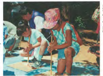
火起こしで縄文時代を疑似体験

市立博物館ホームページ http://www.intership.ne.jp/~kyouiku/m_muse/