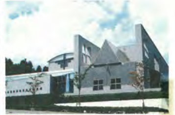
毎年多くの人が来館する市立博物館