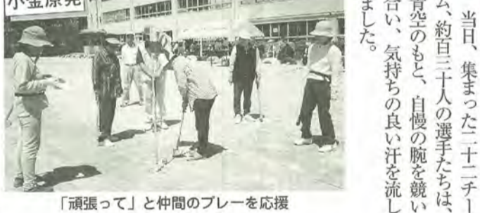
「頑張って」と仲間のプレーを応援

小金原地区は、縄文時代の貝塚が発見されたり、江戸時代は將軍家のお狩場となるなどの歴史を持つ半面、現在では約11,500世帯、31,000人が住む市街化が進んだ地域でもあります。その小金原地区で、昭和46年5月に発足した小金原3丁目町会が今年で30周年を迎え、5月20日に記念式典が催されました。中でも根木内小学校の児童による合唱には大きな拍手が寄せられ、参加した人々は「ウィズ YOU スマイル」という曲名のように、「笑顔で住める街」「ふれあいのある人間性豊かな街」づくりへの思いを新たにしていました。