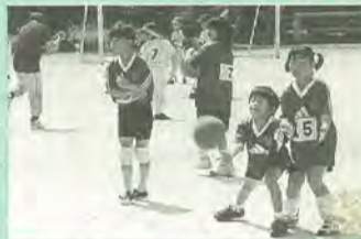
高木第二小学校の校庭で

日曜日の校庭で、ドッジボールやソフトボールに興じる子どもたち。みんな、真剣な表情です。それもそのはず、彼らは五香六実地区子ども会のメンバーで、8月に行われる子ども会対抗の大会「少年少女のつどい(中央大会)」に向けて、特訓中なのです。この大会で優勝することは、子どもたちにとって大きな夢。実現に向けて、ファイト! 園五香六実地区子ども会育成会・林☎387-6879