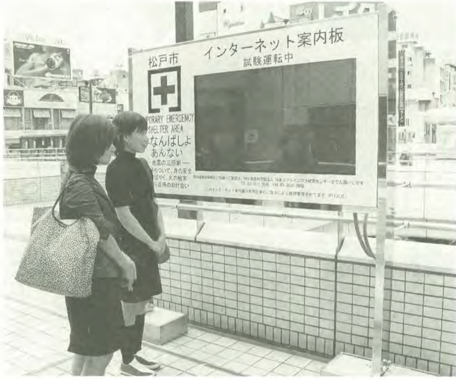
松戸駅西口デッキに設置されたインターネット案内板

市では、平常時における避難場所の周知および災害発生時における迅速な避難場所への誘導など、市民の安全を確保するため、避難誘導街区案内板の整備を年次計画で行ってきました。