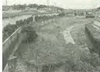
野鳥が飛来する遊水池