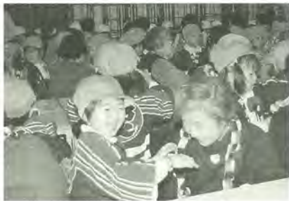
いつまでも、元気でいてね

最後に園児たちは、「いつまでも元気でいてください」と、折り紙で作った首飾りをお年寄り一人ひとりにプレゼント。短い