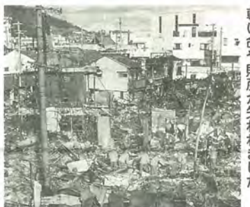
尊い命や財産が失われました

1月17日で阪神・淡路大震災(兵庫県南部地震)から6年が経過します。時間の経過とともに、地震の恐ろしさやいざというときの備えの意識が薄れてきてい