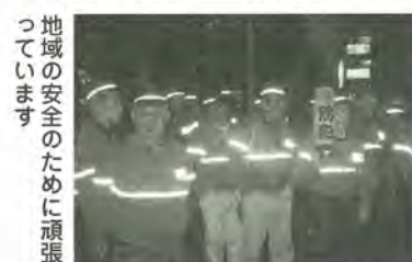
地域の安全のために頑張っています

小金地区での犯罪を未然に防ぐために、今後もパトロールを続けていきたい」と話してくれました。