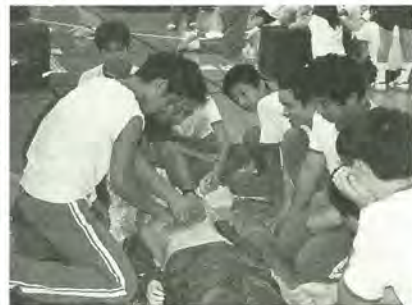
ほくたちにもできる、人命救助

生徒たちは消防署員の指導のもと、心肺蘇生法や止血法などの講習を受講。どれも初めての体験で、緊張しながらも、真剣な表情で取り組んでいました。