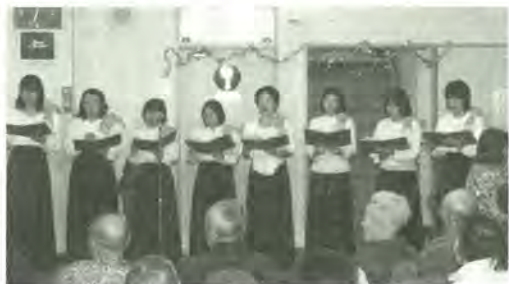
最後に「臘月夜」をみんなで大合唱

これは、入院している患者さんやご家族に「歌のクリスマスプレゼント」と行われたもので、今年で二回目になります。「臘月夜」や「きよしこの夜」など、だれもが口ずさめるような歌を中心のクリスマスコンサート。聴衆の皆さんは、美しい歌声に、うっとりとし耳を傾けていました。