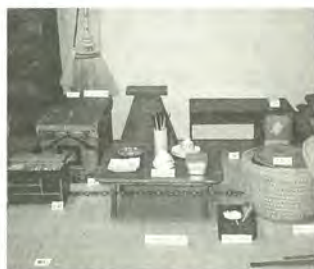
ひと昔前の生活用具