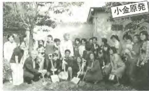
これからタイムカプセルを掘り出します

「いつまでもお元気で」と八ヶ崎第3・4町会は、9月15日に敬老祝賀会を行いました。町会の70歳以上のお年寄りを招待し、八ヶ崎市民センターには100人以上の人が参加。日本舞踊や琴の演奏、マジックショーなどで楽しんだほか、祝いの品が贈られました。なお、町会では、当日参加できなかった人にも祝品をプレゼントしました。