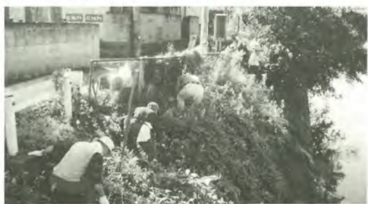
昨年のクリーンデー(河川清掃)