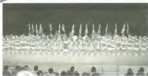
みんな一生懸命に演奏しました

市内の3つの幼稚園は、9月29日、森のホール21で行われた「親子で学ぼう交通安全」の催しのなかで、見事な演奏を披露しました。これは、交通弱者といわれる就学前の幼児の交通事故を抑制するため、幼稚園児とその家族を対象に開催した交通安全イベントでの一コマ。松戸みどり幼稚園はやさしい音色のミュージックベルで、また大勝院幼稚園・あさひ幼稚園はフラッグの演技を取り入れたマーチングドリル演奏を行い、参加者から大きな拍手が送られていました。