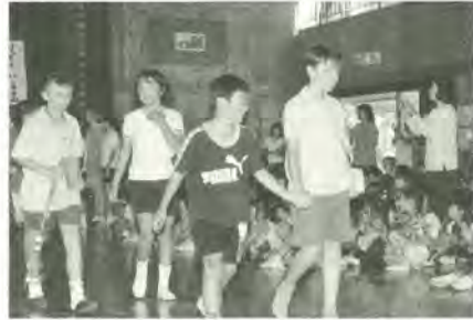
オーストラリアの友人を全校生徒で迎えました

一行は9月27日から30日まで河原塚小学校の児童宅にホームステイし、また、同小学校で一緒に授業を受けたりと楽しい時間を過ごしました。