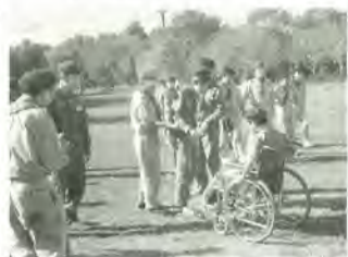
秋の楽しい野外活動

「ハンディキャップを持っていても、みんなと一緒に仲間になって、活動できる、楽しめる」を趣旨に発足した「ボーイスカウト松戸第7団」「ガールスカウト千葉県第85団」。