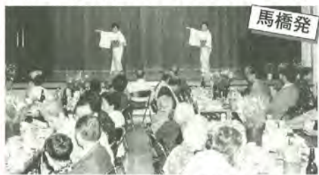
会場には笑顔がこぼれていました

「いつまでもお元気で」と八ヶ崎第3・4町会は、9月15日に敬老祝賀会を行いました。町会の70歳以上のお年寄りを招待し、八ヶ崎市民センターには100人以上の人が参加。日本舞踊や琴の演奏、マジックショーなどで楽しんだほか、祝いの品が贈られました。なお、町会では、当日参加できなかった人にも祝品をプレゼントしました。