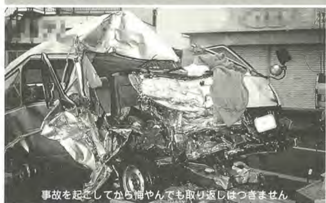
事故を起こしてから悔やんでも取り返しはつきません