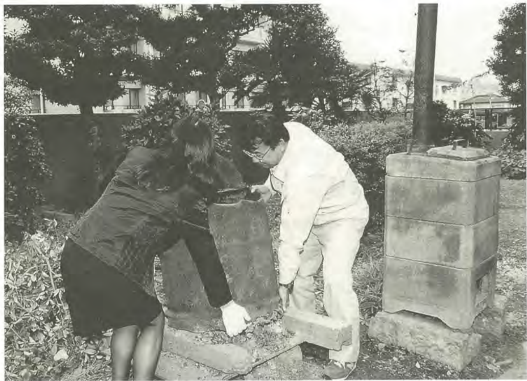
不用になった焼却炉は市が回収します