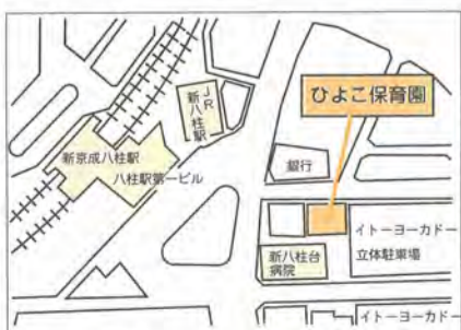
ひよこ保育園案内図

新八柱台病院附属「八柱乳幼児健康支援デイサービス」および「ひよこ保育園」 所在地:松戸市日暮一の七の二(下記案内図を参照、☎367-8351番)