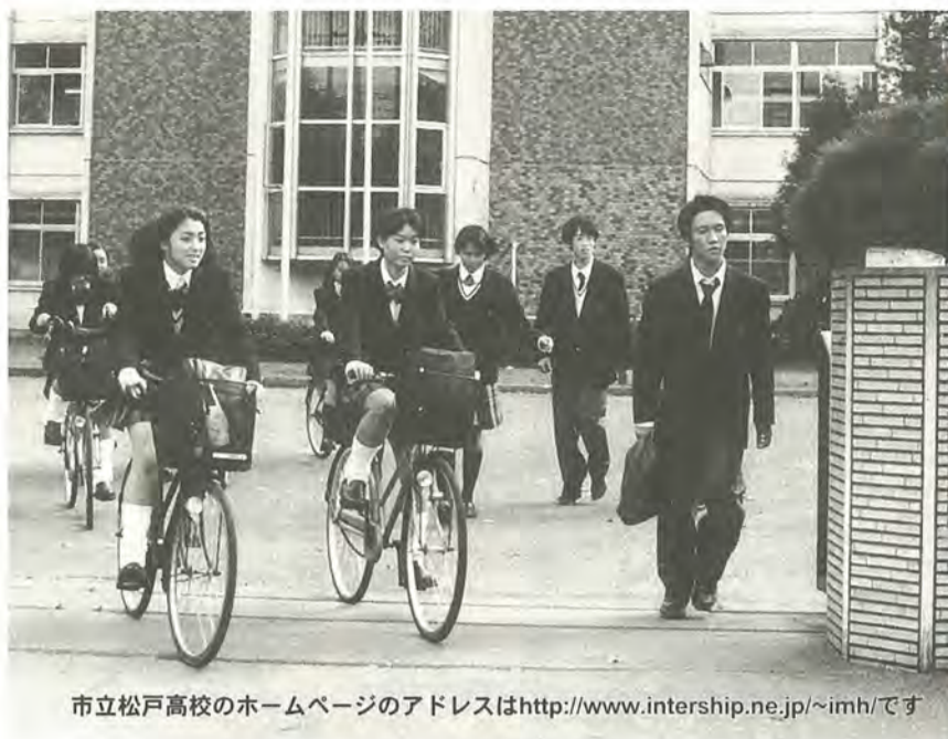
市立松戸高校のホームページのアドレスは http://www.intership.ne.jp/~imh/ です