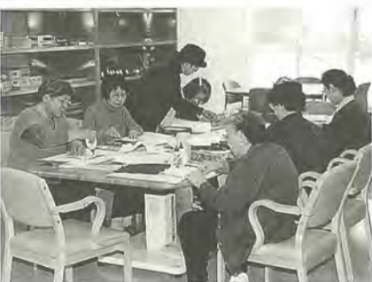
デイサービス講座の手工芸教室

研修 日時：12月13日（日）午後1時～4時 会場：健康福祉会館ふれあい22 三階研修室 内容：①健康福祉会館について②ボランティアに期待するもの③ボランティア活動を始めるにあたって④ボランティア保険について⑤健康福祉会館の施設見学 対象：高校生以上の人間 費用：無料 申込：12月10日（木）までに、電話またはファックスで健康福祉会館ふれあい22 ☎ 363・7111 番 ☎ 363・7810 番へ