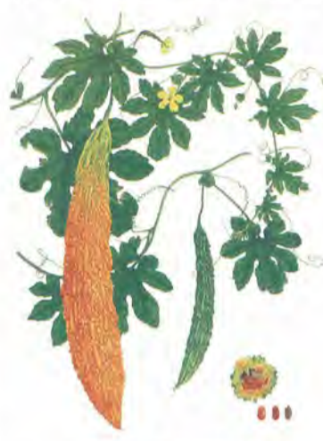
受賞作品「ニガウリ」

第一位の文部大臣賞に輝いた。このコンクールでは、植物画を始めた中学一年生の時から四年連続入賞、同賞も二度目の受賞という実力派。