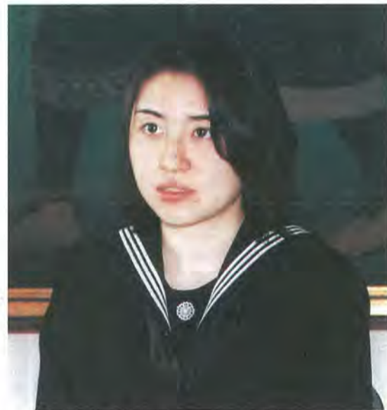
国立科学博物館第14回植物画コンクール 文部大臣賞受賞

細かな線を描くときは、ぐっと息を止めて精神をその画筆に集中する。苦心の末に描き上げたときの喜びは大きい。今回、画題に選んだニガウリは、自宅近くの畑で見つけ、農家から分けてもらった。