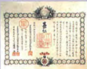
勲一等旭日桐花大綬章勲記