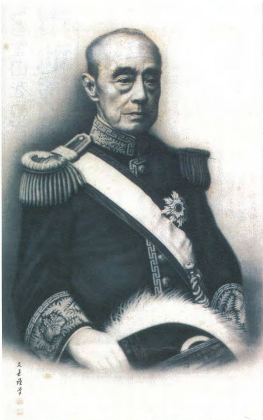
徳川慶喜肖像縮繪