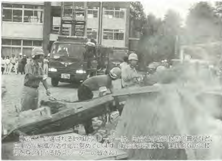
冊会ごとに選ばれる地域防災リーダーは、町会での防災技術の普及など、自主防災組織の活性化に努めています。(総合防災訓練で、実践的な防災技術を身に付ける防災リーダーの皆さん)