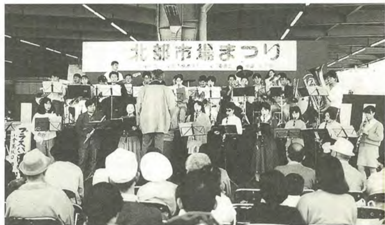
親子で楽しめる催し物もたくさん用意されています