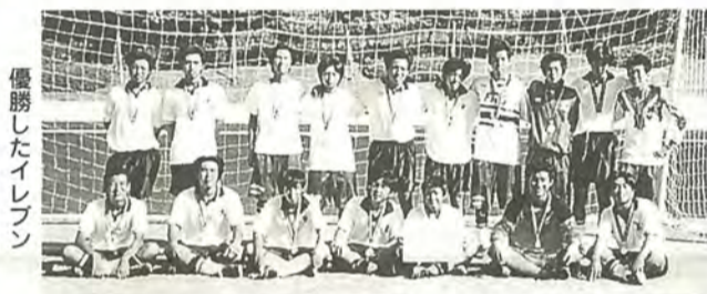
優勝したイレブン