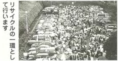
リサイクルの環境として行います

不用品でも、ほかの人が使えるということを実験的にわかってもらえるのがフリーマーケット。一度、ご来場ください。 日時…10月26日(日)午前10時～午後2時 会場…クリーンセンター (高柳新田) ☎清掃管理課ごみを減らす係