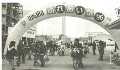
家族で楽しめるイベントが盛りだくさん