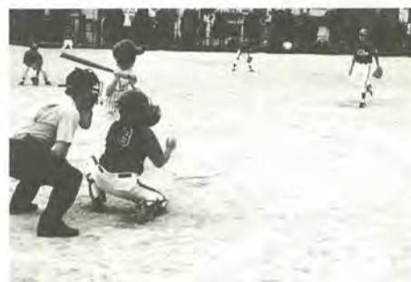
夢はプロ野球の選手です

青少年相談員の新松戸支部は、9月7日馬橋北小学校で子どもたちの健やかな成長と地域の人たちとの交流を目的に、スポーツ大会を開催しました。当日は、馬橋西地区・新松戸地区の子ども会ソフトボールチーム13チーム・ドッジボール16チームの児童約400人が集い、秋空の下、元気に戦いました。