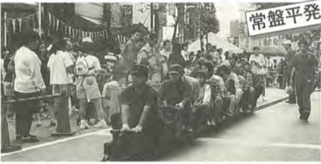
ちびっこに大人気のミニSL、長蛇の列ができました

9月28日、八柱駅前通りとサンセット通りを歩行者天国にして、八柱あいさつまつり & ふれあい広場が開催されました。少し汗ばむほどの陽気で、多くの人々がミニSLや和太鼓の演奏・射的などを楽しみました。また、サンセット通りで行われたバザーの売上金は、ユニセフを通じてアフリカ難民救済に使われます。