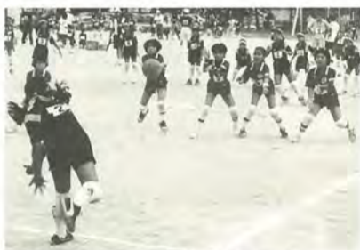
満身の力を込めて投げました

健康懇談会「循環器疾患と血液疾患について」 10月16日(木)午後7時～9時 会場新松戸市民センター 定員当日先着五十人 費用無料 ☎愛内科クリニック ☎348-4817番 スクエアダンス初心者講習会 11月2日から毎週日曜日(全二十回)午後1時～3時 会場小金北市民センター 内容カントリ音楽で踊るアメリカ生まれのグループダンス 費用一回五百円 ☎松戸スクエアダンス・西澤 ☎341-2176番