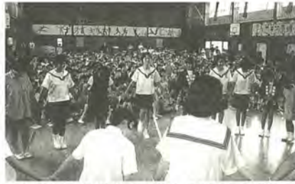
河原塚小の児童も南洋小の踊りに飛び入りで参加

10月4日・5日、稔台神社境内と稔台中央通りを会場に、みのり台ふるさと祭りが行われました。この祭りは、昭和20年10月3日、当時練兵場だった稔台に開拓の鎌(くわ)が入った日を記念して始められたもので、神輿(みこし)や山車の巡行、カラオケ大会、祭り太鼓と盛りだくさん。5日は天気にも恵まれ、たくさんの方が模擬店をのぞき込み、お店の人と「お買い得だよ」「もうちょっとまけてよ」とやり取りを楽しんでいました。