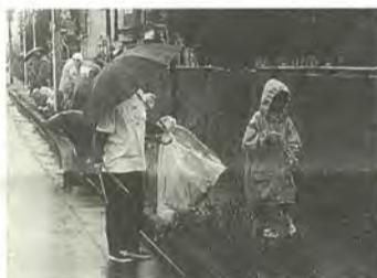
小さなごみも見逃しません

10月19日(日)午前11時～午後3時 会場宝酒造(株)松戸工場(JR北松戸駅徒歩五分) 内容工場見学・キャラクターショー・歌謡ショー・模擬店・わんぱく広場ほか 費用入場無料 ※車での来場はできません。 ☎宝酒造(株)松戸工場総務課 ☎362-0261番