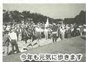
今年も元気に歩きます

毎年、街路樹の葉が色づくころ、小金地区の町会は、「歩こう会」を開催。小さい秋を見つけながら、東漸寺から21世紀の森と広場までの約4kmの道のりを一緒に歩きましょう。