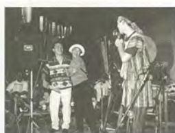
ミニコンサートなど盛りだくさんの企画を用意します

8月9日(土)午後6時30分〜8時30分(裁判所前集合 雨天中止) 会場中央公園 内容五感を使ったゲーム 費用二百円 問まつとネイチャーゲームの会・山中☎342・4335番(夜間のみ)