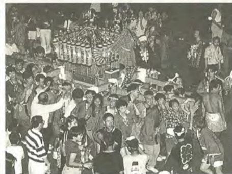
まつりの華 神輿渡御