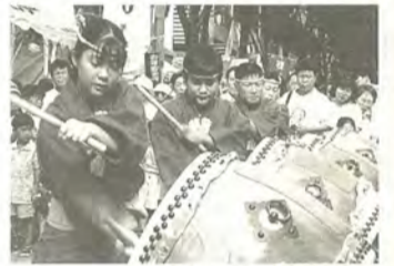
見事なバチさばき

日時…7月19日(土)・20日(日)、各午前10時～午後9時 会場…新松戸けやき通り(ダイエー新松戸店～きょうちくとう通りまで歩行者天国) 内容…19日=プラスバンドパレード・ミニS.L.・かっぱれ・新松戸おどり・神輿渡御(みこしとぎよ)ほか 20日=子ども神輿・山車パレード・ミニS.L.・日本太鼓・鳴子おどり・神輿渡御・新松戸おどりほか 囲新松戸まつり実行委員会・宮井☎347-5353番