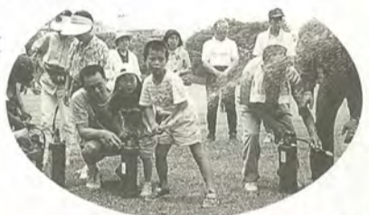
子どものときから実体験

6月15日に松戸市防火協会六実支部主催の防火グラウンドゴルフ大会が六実中央公園で行われ、地元町会・自治会など20チーム(1チーム6人)が熱戦を繰り広げました。競技の後は応急手当の講習、消火器の使用方法、起震車体験など防火・防災訓練も行われ、こちらも真剣な表情で取り組んでいました。