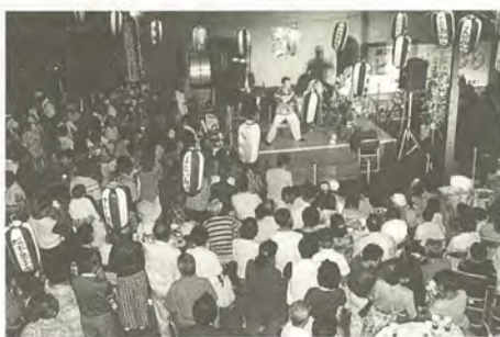
納涼気分の中で楽しく地域交流を図りませんか