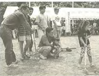
ねらえ!ホールインワン