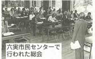
六実市民センターで行われた総会