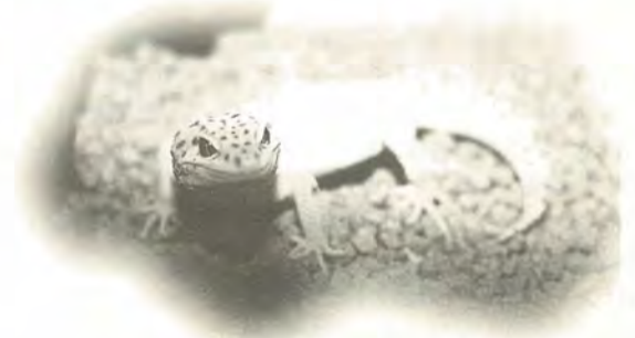
色彩変異により体の色素がなくなり、白色に変化したアルビノトカゲモドキ