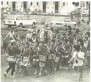
町会手作りの樽神輿