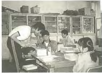
作業ではプランターカバーを作りました