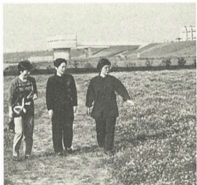
5月10日にレンゲ祭りをを行います

今、江戸川河川敷のお花畑では、レンゲの花が見ごろです。ひばりのさえずりも聞こえ、河川敷や土手の散策も楽しめます。ぜひ一度お出かけください。 場所 古ヶ崎地先江戸川河川敷(松戸三郷有料橋下流) 川川をきれいにする課 ☎362・9337番