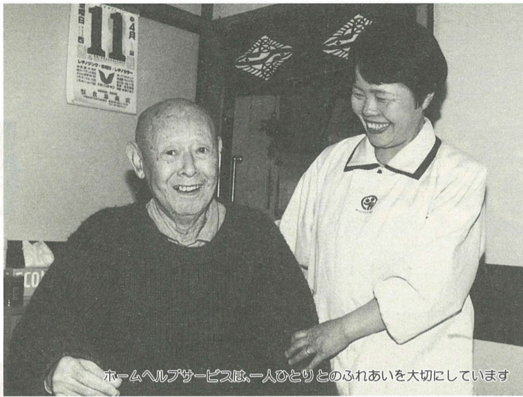
ホームヘルプサービスは、一人ひとりとのふれあいを大切にしています

市では在宅福祉サービスを充実させるため、ホームヘルプサービスや訪問入浴サービスなど、日常生活に支障のあるお年寄りや身体の不自由な人などを支援しています。 今後もよりきめ細やかなサービスを提供できるよう整備を図ります。 圓おせわ課おせわ係