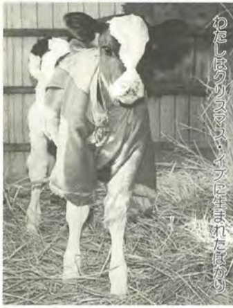
わたしはウシです、イブに生まれたばかり