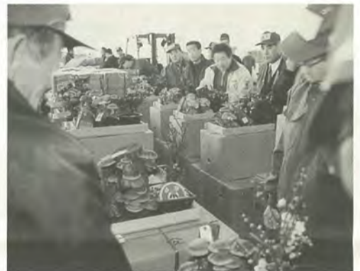
初荷の飾りシイタケのセリ

1月5日(日)、市民の台所を預かる公設地方卸売市場の北部市場で初セリが行われました。以前は、宝船を型どって飾り立てられたネギなどの初荷もありましたが、最近は姿を消し気味とか。それでも、鉢植えの梅などで飾られた縁起物の飾りシイタケが、早速セリに掛けられていました。 圃北部市場☎341-6161番