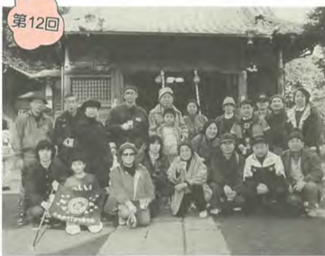
最後は自宅近くの小金原茂侶神社に参拝