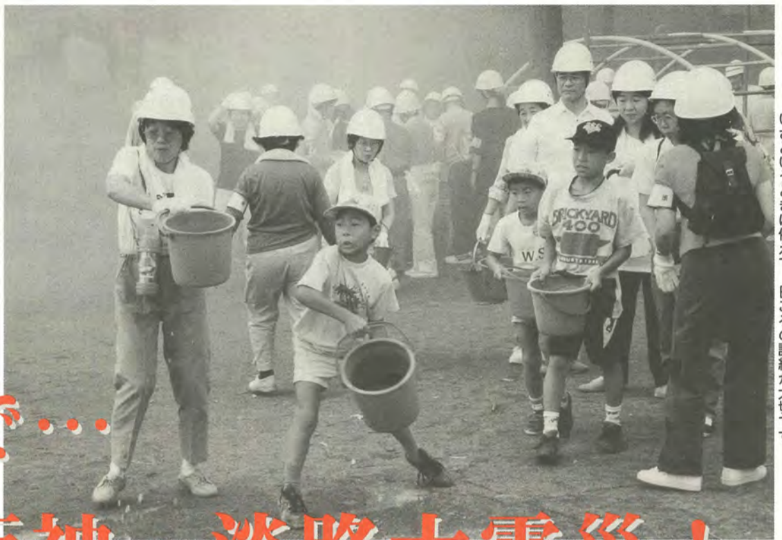
いざというときに備えて、日ごろの訓練が大切です