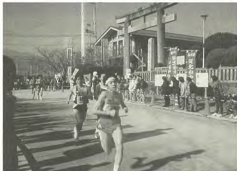
力走する小金南中の生徒(中央後方)

熊本県熊本市で12月26日行われた全国中学校駅伝大会に、小金南中学校が出場しました。当日、発熱のため欠場した選手も出ましたが、初出場にもかかわらず19位と健闘しました。