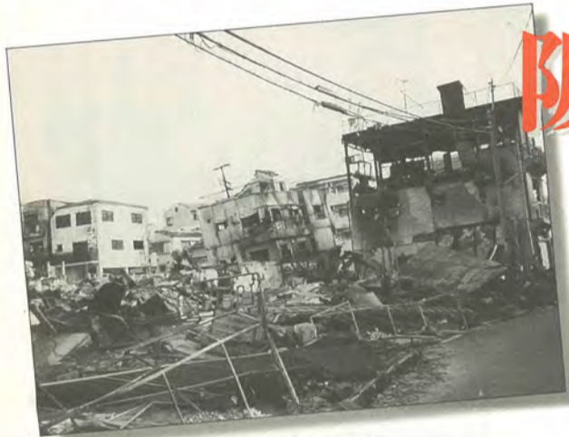
震災直後の神戸市内