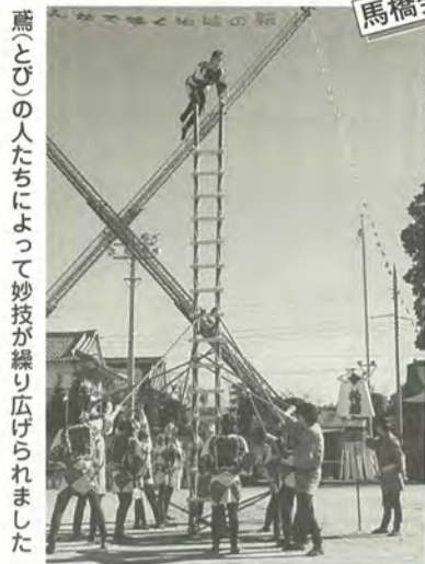
薫(とび)の人たちによって妙技が繰り広げられました