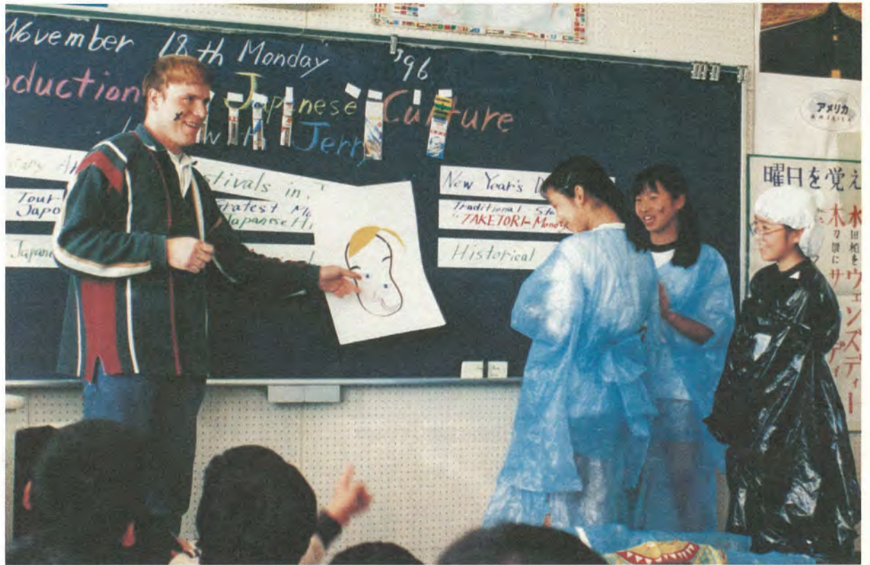
活動の中心はもちろん英語の授業

授業は英語担当の教師との共同授業。「楽しく学ぶ」をモットーに、「習うより慣れろ」で進められています。この日は生徒の脚本による英語劇を行いました。