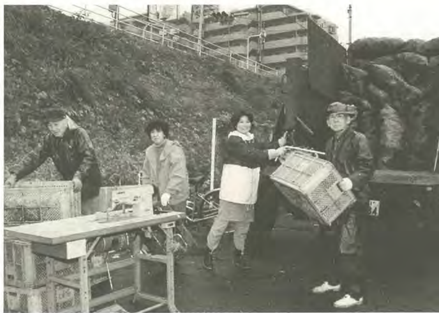
リサイクル活動による資源物の回収量は増えています

市では、家庭から出されるごみを燃やせるごみ、燃やせないごみ、資源ごみ、粗大ごみなどに分別して収集し、ごみの減量化・再資源化に取り組んでいます。