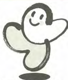
千葉県福祉のまちづくりのシンボルマークが決まりました

募集人数…40人 ※高等課程(准看護科)は募集しません。 ※入学願書は有料で配布しています。 ☎市立病院附属看護専門学校☎67-4444番