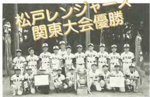
まずは甲子園が目標だ