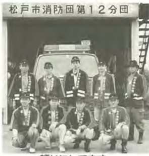
頼りにしています

松戸市消防団第十二分団では、毎月管内巡回や、二、三カ月に一回はポンプ車の点検と放水訓練を行っています。また、火災や災害時には消防署から連絡が入り、団員は直ちに出勤。現場の交通整理や、火災時には消火作業・後始末など幅広い活動をしています。