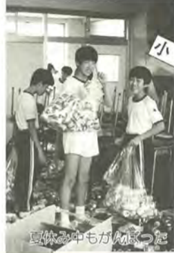
小金発 発表会でも環境問題に

小金南中学校の一年生が、今年7月から空き缶を集めはじめて三カ月、校庭に縦七横二十二びの大壁画を完成させました。環境教育を進めている同校は、「机の上で学んだだけでは、環境問題を実感することは難しい。問題に気付き、考え、行動に移すことが大切」と、その気持ちを壁画に表現しました。