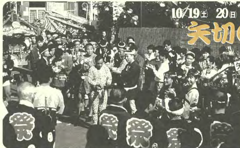
威勢のいい若衆がワッショイワッショイ

北総歩こう会 月一回日曜日または祝日、午前8時～午後4時 内容市内および周辺のウォーク 費用無料 関横山 ☎92-3088番 はなみずきの会(手編み) 毎週水曜日午前10時～午後1時 会場女性センター ゆうまつり 費用月三千六百元(入会金三千円) 関渡辺 ☎88-8921番