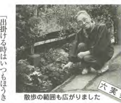
散歩の範囲も広がりました

「出掛ける時はいつもぼうしとカマを持って行くんですよ」健康のために歩いた方がいいと言われて、近所を歩いているうちに、ごみや雑草が気になり、掃除をするようになった戸田テ