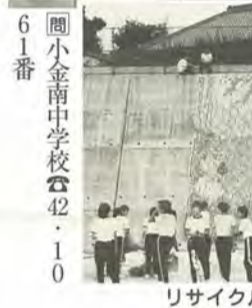
リサイクルをPRした絵柄です

小金南中学校の一年生が、今年7月から空き缶を集めはじめて三カ月、校庭に縦七横二十二びの大壁画を完成させました。環境教育を進めている同校は、「机の上で学んだだけでは、環境問題を実感することは難しい。問題に気付き、考え、行動に移すことが大切」と、その気持ちを壁画に表現しました。