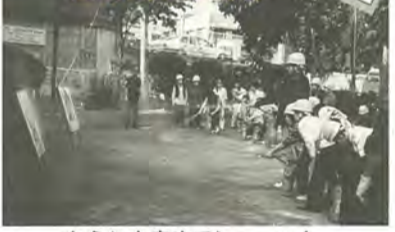
ねらいを定めてシュート!