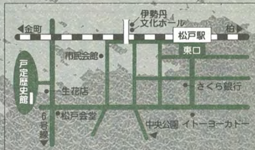
戸定歴史館案内図