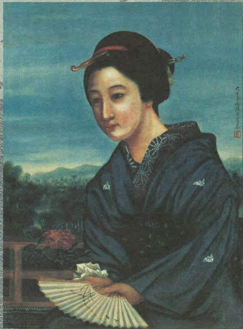
薔薇を持つ女。幕末に描かれたと推定される油絵。背景を風景とするなど霞谷の西歐絵画に対する理解の深さがうかがわれる。