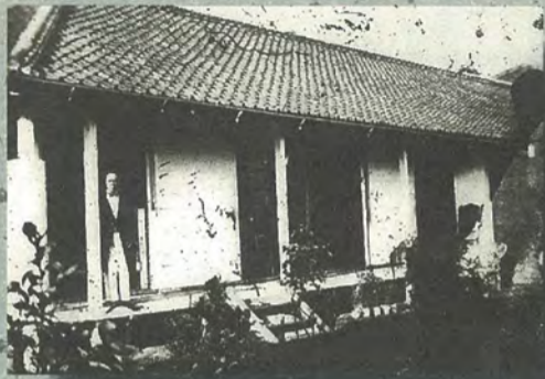
開成所内部当時最新の情報、最高の人材が集まっていた開成所。現在の東京大学の前身。今回が初公開。