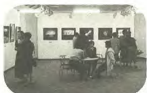
会場の至る所で芸術談話に花が咲きます