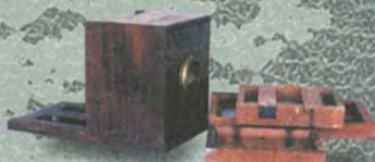
島霞谷所用のカメラ

光と影による写真の描写を人間の手により再現したモノトーンの肖像。河田相模守は霞谷が開成所入所時の頭取。