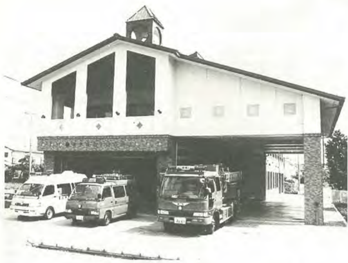
市内10番目に開署した切妻屋根が特徴の八ヶ崎消防署

八ヶ崎消防署には、水槽付消防ポンプ車、ミニ消防車、救急自動車、指揮車が一台ずつ配置され、職員二十九人が二十四時間体制で勤務しています。また、松戸市消防団に八ヶ崎