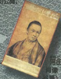
河田相模守肖像（島霞谷筆）

光と影による写真の描写を人間の手により再現したモノトーンの肖像。河田相模守は霞谷が開成所入所時の頭取。