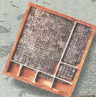
島霞谷発明活版活字 わが国で最初に実用化された近代金属活字。明治初期以前の活字がほとんど残らない中での貴重な資料。