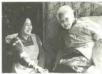
サービスだけでなくふれあいも

福祉公社は、高齢者や障害を持つ人が必要とする家事援助などのサービスを、地域の人の参加と協力により、有償で提供しています。公社は、サービスを利用する利用会員とサービスを提供する協力会員、事業に賛同していただける賛助会員によって成り立っています。