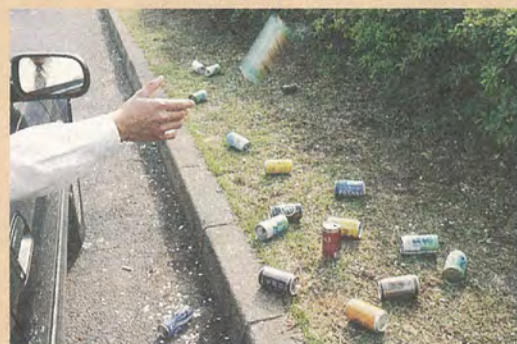
みなさんのご意見をお待ちしています