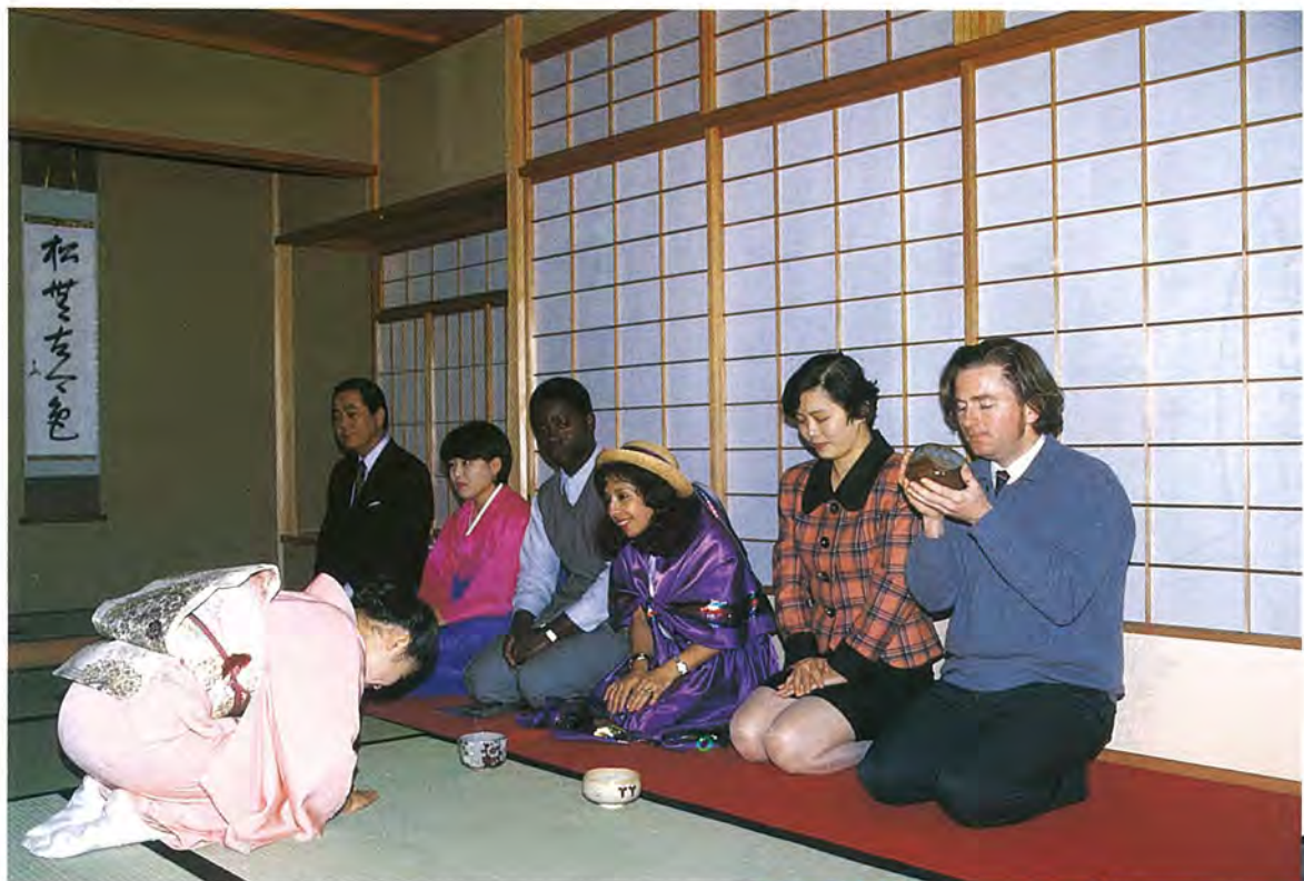
けっこうなお前でした(松雲亭で)