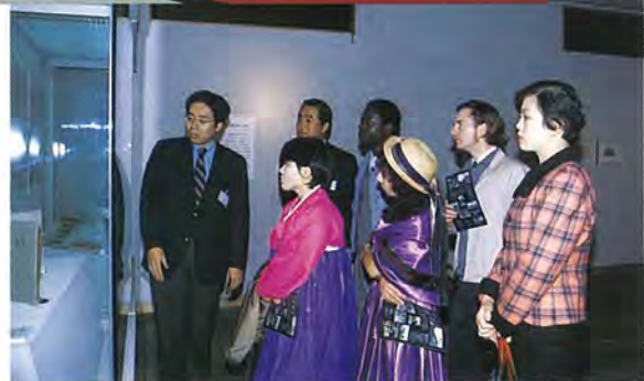
徳川家の資料にも興味を示していました(戸定歴史館で)