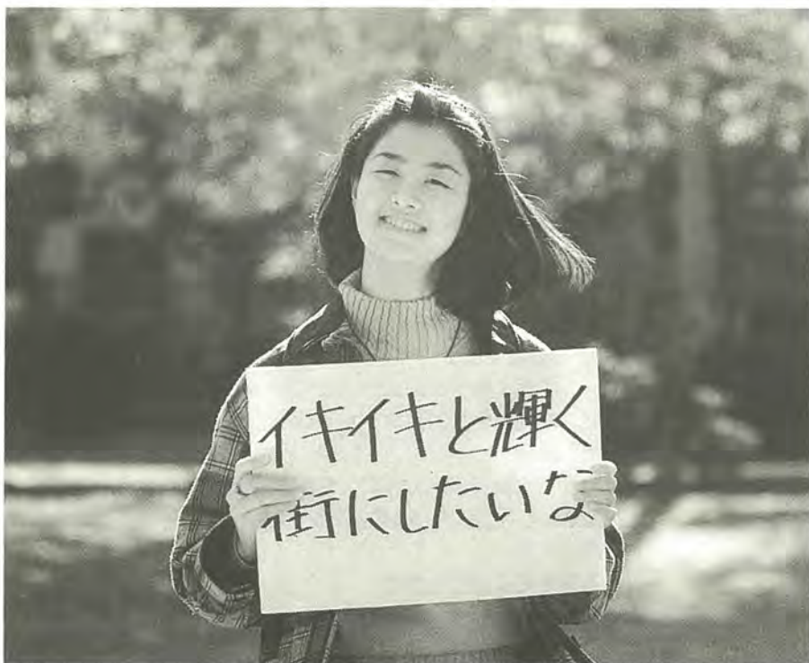
あなたのご意見をお待ちしています

駅の周辺には、年々新しいビルが建っていますが、景観的にはどうでしょうか。もう少し統一性を持たせて、調和のとれた美しい街並みにしてほしい。