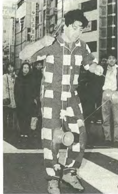
大道芸を街角で披露

1953年ハンガリー生まれ、1988年から日本に在住。数学者で、11カ国語を話し、40カ国以上に滞在し、大道芸人としても活躍。その豊富な異文化体験を通し、日本について見たり、聞いたり、感じたことをお話しします。