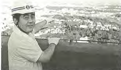
煙突の頂上から市内を臨む

今月の10日、和名ヶ谷クリーンセンターが無事竣工式を迎えることができました。建設に当たっては、地域にお住まいの方々から多大なご理解とご協力をいただき、改めて地元関係者の皆様に御礼申し上げます。