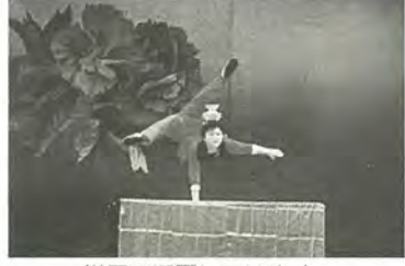
世界で活躍しています