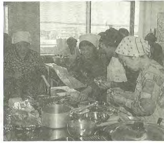
成人病予防教室(調理実習)

【結果説明会(健康教育)】 健康診査を受けた人を対象に、健康診査結果の説明と健康に関する講話が医師会の医師により行われています。毎年テーマが変わり、今年は「骨粗鬆(しょう)症のはなし」の予定です。健康診査を受けたときに日時・会場をお知らせします。 【成人病予防教室】 健康診査の結果に基づき、調理実習や運動を体験しながら、自分の日常生活を振り返る教室です。