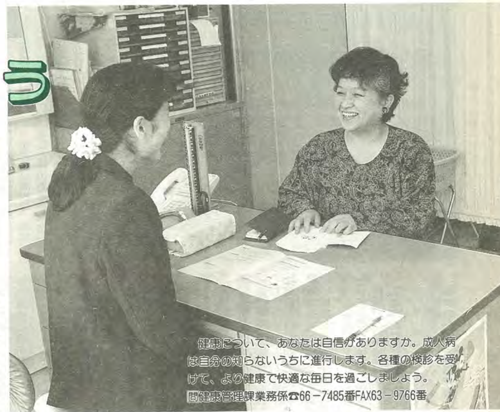
健康診査の結果を説明している医師と患者の会話の様子

【対象者には 個人通知をします】 健康診査の案内は、三十歳以上の女性と、四十歳以上の男性全員を対象に、4・5月に個別通知します。受診するときは、共通受診券に必要事項を記入し、受け付けに提示して裏面の受診記録欄に押印を受けてください。 【基本健康診査】 受診方法：集団健康診査場で受診する方法と個別委託医療機関でも受診する方法があります。どちらでも都合の良い日時・会場でお受けください。年齢などにより受け方が異なりますので、表①で確認してください。 【結核住民健康診査】 集団健康診査場で十五歳から受診できます。 【成人歯科健康診査】 後日、広報まつどで詳しくお知らせします。 【費用免除制度も あります】 老人医療受給者証をお持ちの人、生活保護世帯・市民税非課税世帯の人は、費用が免除されます。受診会場・医療機関で申し出てください。