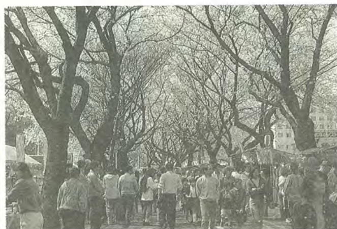
常盤平の桜通りは、総延長4.3kmに約640本の桜が咲き乱れました

私たち仲間は南房総電車の旅を計画し、2月下旬に館山方面に行ってきました。周囲を海に囲まれた房総は、車窓からの眺めも美しく、海岸線は磯の香り、砂浜もすてきでした。 フラワーラインは、バスを利用しましたが、見渡す限りの花畑は、ポピー、きんせんか、ストック、菜の花でいっぱい。美しい花の楽園に迷いこんだかのようで、春真っ盛りでした。 次の観光地白浜に向かう途中、旅は道連れと新しい仲間が加わり、たくさんのお土産と美しい自然と澄んだ空気をたっぷり満喫した私たちの素晴らしい房総の旅は、たくさん思い出を残してくれました。