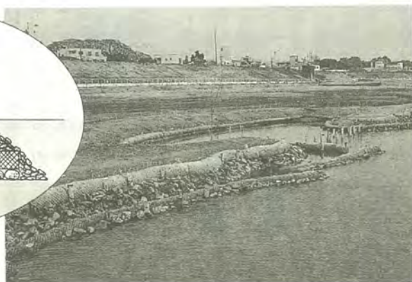
このような護岸が約860m続きます