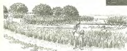
3~5年後のイメージスケッチ