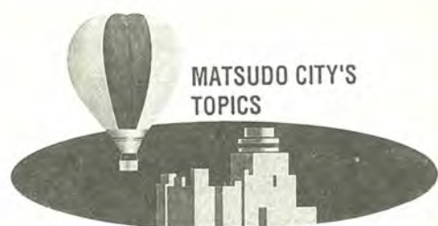
MATSUDO CITY'S TOPICS

初めて来ましたが、行けども行けども続く桜のトンネルにびっくり。その美しさに圧倒されました。