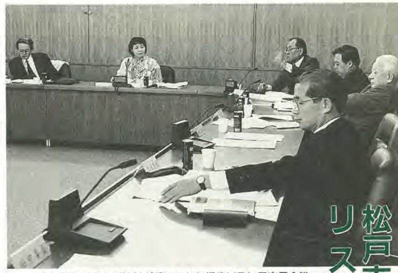
半年間にもおよび検討が重ねられた行政リストラ市民会議