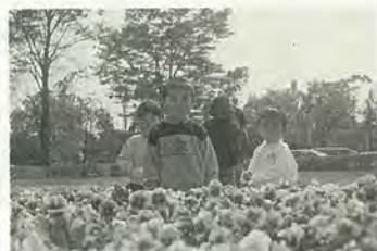
※タイトルが色刷りのものは、市の主催です。

フラワーアレンジメント 特別講座 4月30日(日)午前10時30分 午後2時 会場常盤平市民 センター 費用花材費二千円 園フローラル・アート花の友 の会・阿部 49-00008番