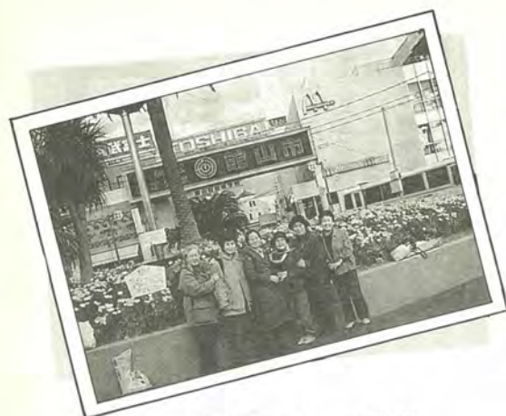
房総は春真っ盛り