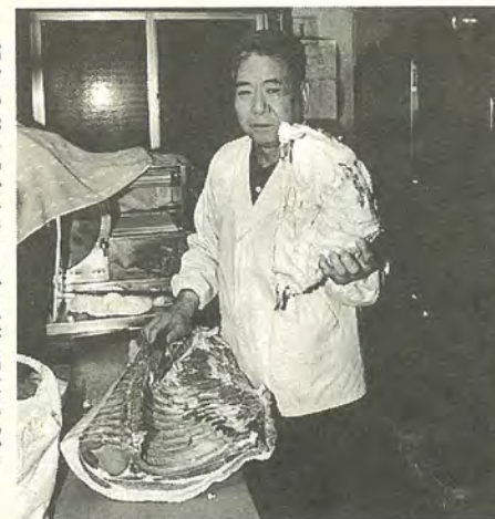
脂身も売るので、あまりごみが出ないんだ