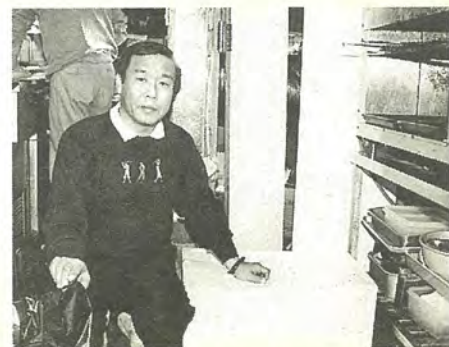
発泡スチロールの魚箱も再利用するなど、ごみを減らす工夫もしています

費用以外では、ごみの保管場所も悩みのタネです。私も含めて、この周辺は借り店舗で狭いお店が多いですから、ごみを置いておく場所もあまりないし、かといって店内に置くのも衛生的にまづいし、なるべくごみが出ないように工夫をしています。例えば魚を仕入れるときに使う発泡スチロールの容器も、何度も使うようにするなど、無駄をなくすようにしています。