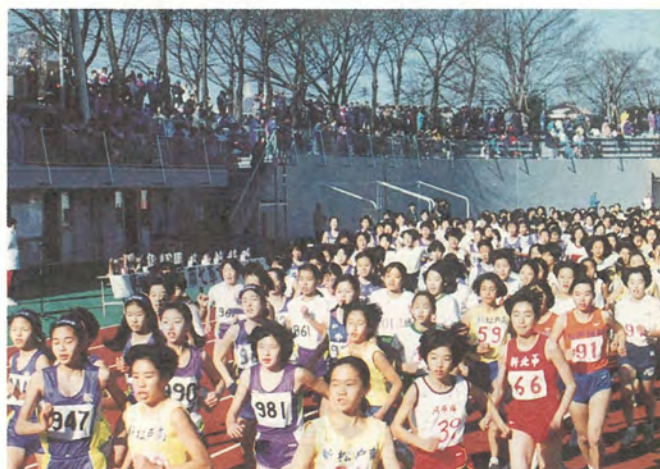
声援に送られ、力走するランナー

松戸市七草マラソン大会が1月8日、昨年改装された運動公園陸上競技場をスタート(ゴール)として行われました。