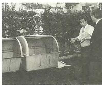
生ごみは袋に入れてフタ付きの容器に保管しています

松戸店に来る前は都内のお店だったので、ごみの保管場所が大変苦痛でしたが、こちらは幸いスペースに恵まれていますから分別が徹底できました。今のところ、紙とか割りばしなど燃やしやすいものは焼却炉で燃やしてしま