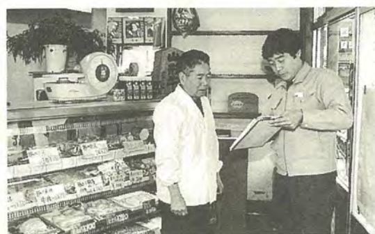
ごみはどのくらい出ますか?

というのよ、これがきっかけになってごみのことを良く考えるようになると思うからなんだよ。まあ、いろんな考え方がるので、