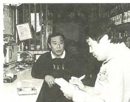
組合でも、ごみ問題への関心が高いですね

私が加入している飲食店組合でも、ごみ問題への関心が高く、いろいろ勉強しています。