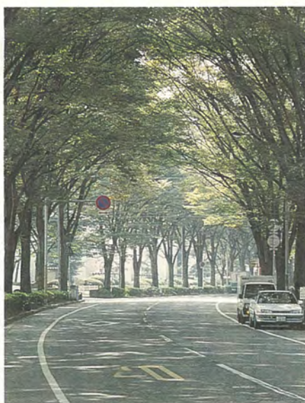
夏には1kmも続く緑のトンネル

市では認定証のプレートを現地に設置し、今後もケヤキ並木を守り続けていくことにしています。