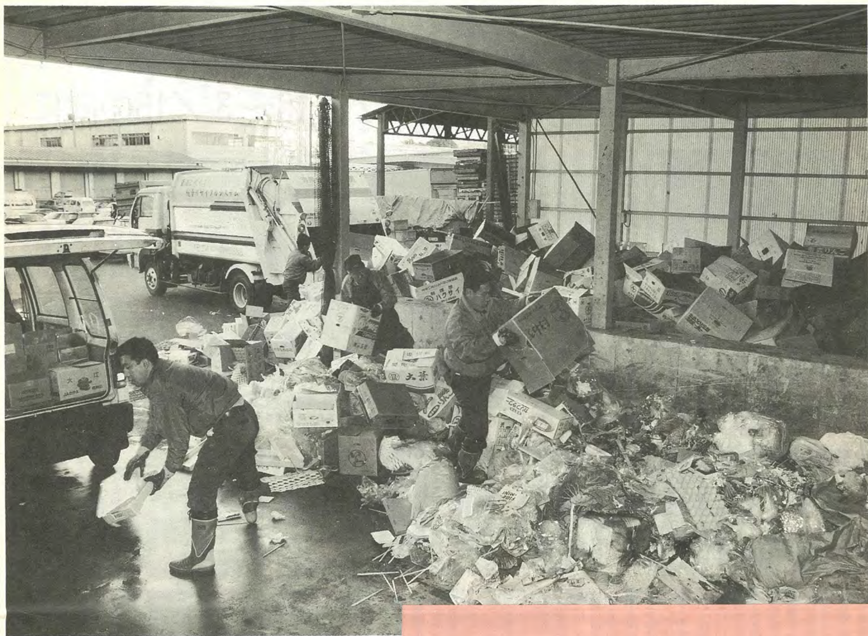
段ボール箱に詰められて出されたごみも、資源ごみ、燃やせるごみ、燃やせないごみにきちんと分別されます(総合卸売市場北部市場)