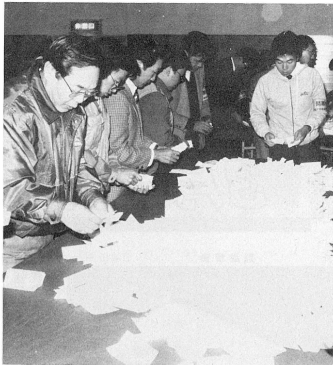
みなさんの一票が新しい千葉をつくります