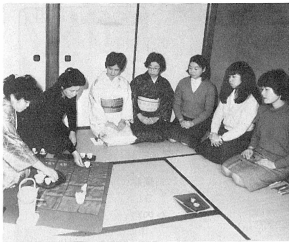
心が落ち着きます