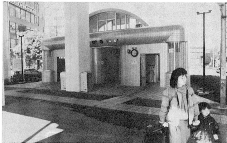
モダンな明るいトイレが完成しました。

新松戸駅前に、モダンな公衆便所が二月二十六日完成しました。 この公衆トイレは、モンゴル人の住居に似ていることから、地元の皆さんが「パオ」と愛称をつけました。 側面を半円形にモザイク貼りした「パオ」は、ガラスブロックをうまく使用し、自然光を内部に取り入れるなどして、明るい雰囲気のトイレになっています。 また身障者用のトイレも設置され、手を使わなくても水が流れるよう設計されています。 地元の皆さんの意見を取り入れた公衆トイレは、県内で初めて、またひとつ新松戸の名所がふえました。