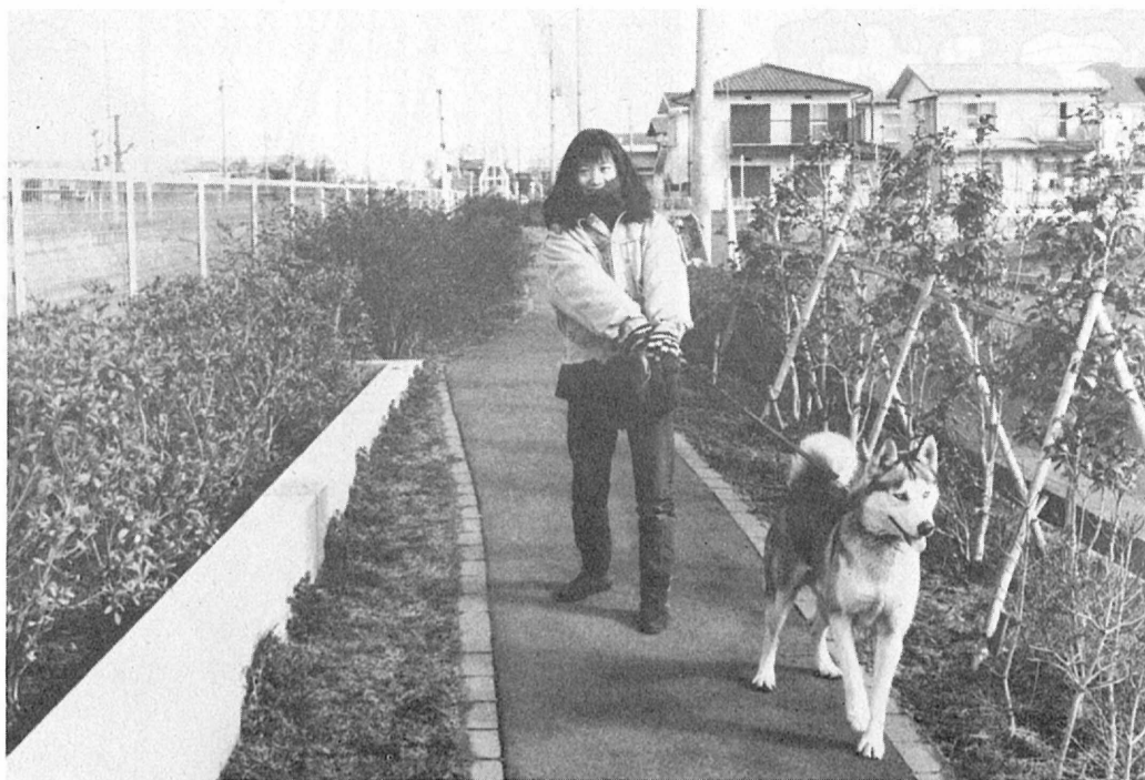
飼い主しだいで街はきれいに