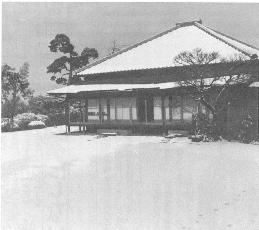
歴史公園に予定されている戸定ヶ丘(写真は戸定館)

▽松戸市立中学校設置条例：小中学校の過大規模を解消するため(小金北中学校を幸田二〇六番地に建設)