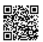
まつどのキッチン