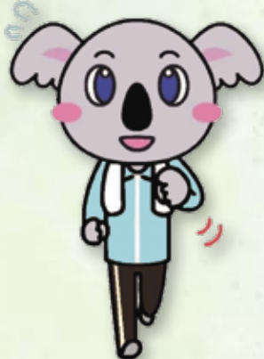
健康松戸21 マスコットキャラクター 「けあら」

健康診断を受けたり、健康づくりに関するイベントなどに参加して 1050マイルを貯めて健康と特典をゲットしよう！