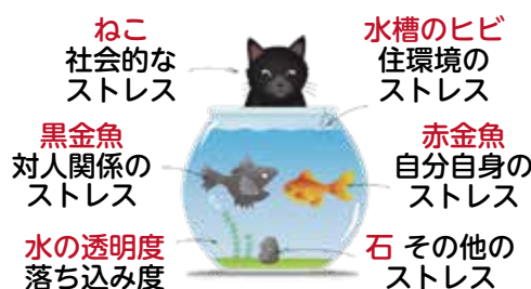
本人モード結果画面(例)