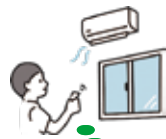
エアコンの早期点検!