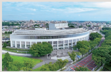
森のホール21(松戸市文化会館)