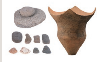
幸田貝塚出土品(国重要文化財)