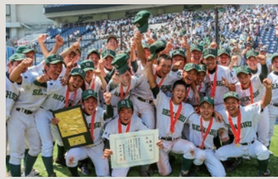
専修大学松戸高等学校甲子園出場(平成27年)