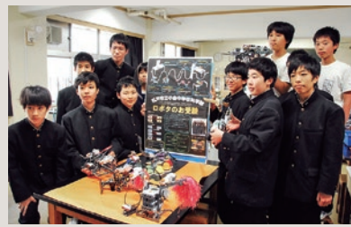
小金中学校科学部(平成24年)