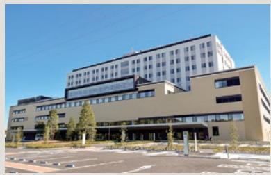
市立総合医療センター開院(平成29年)