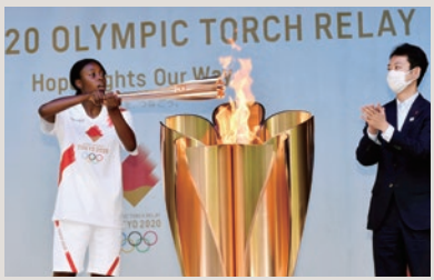
東京2020オリンピック聖火リレー点火セレモニー