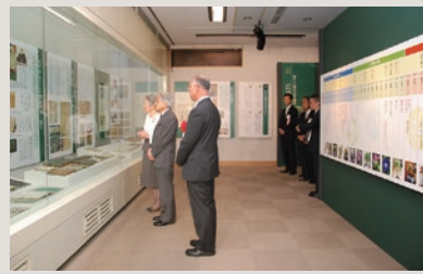
戸定歴史館をご覧になる両陛下(平成21年)