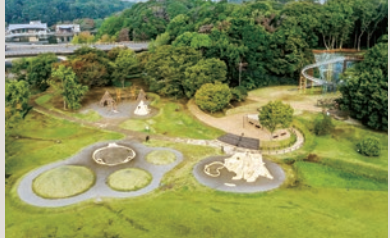
「あそびのすみか」の大型遊具