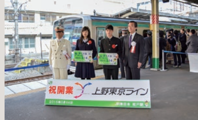
上野東京ライン開業(平成27年)