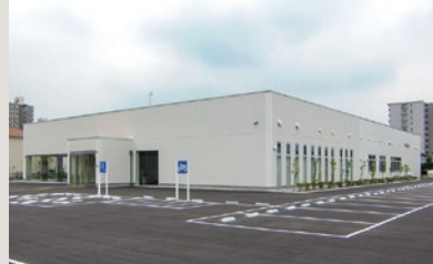
市民交流会館「すまいる」