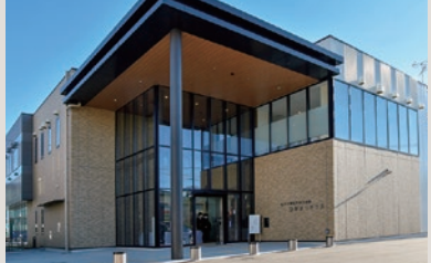
東松戸複合施設「ひがまつテラス」