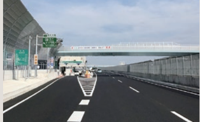
東京外環松戸インターチェンジ