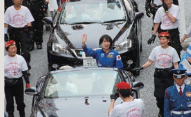
宇宙飛行士・山崎直子さん帰還歓迎パレード