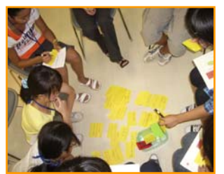
未来を想像しよう