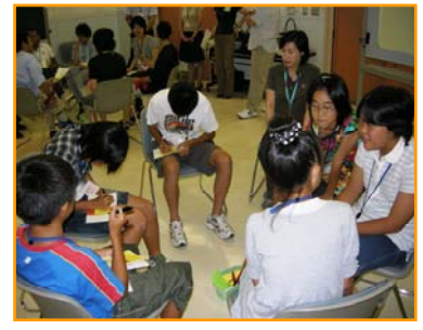
松戸のすきなところ…