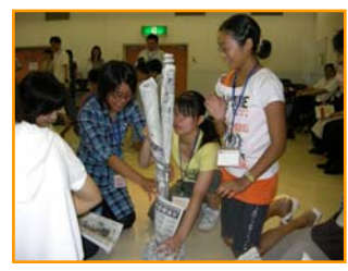
新聞タワーゲーム