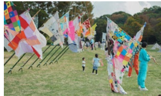
21世紀の森と広場「松戸アートピクニック」の様子