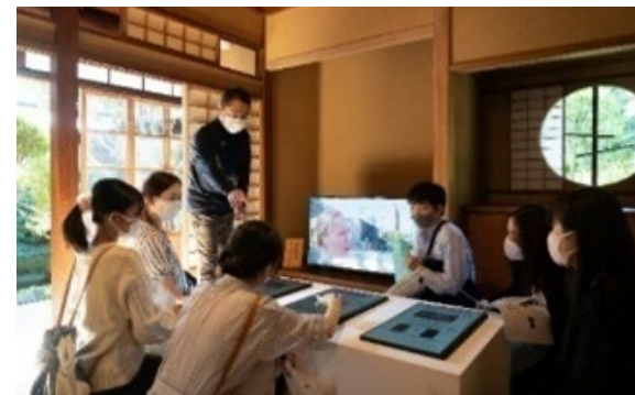
芸術祭「科学と芸術の丘」の様子