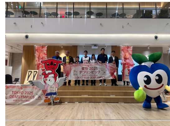
デフリンピック応援イベントの様子