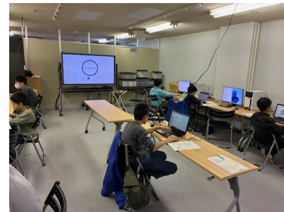
クリエイティブラボ「プログラミングチャレンジ」