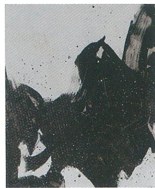
《はじまりⅣ》2018年 20号 キャンバスにアクリル