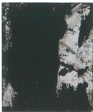
《はじまりⅡ》2018年 20号 キャンバスにアクリル

フィナーレ国際展 金賞・サロンド・メ招待出品（パリ）・リアルテヌペール招待出品（パリ） キューバ展招待出品（キューバ）・YOKOHAMA NICAF（国際コンテンポラリーアートフェスティバル'93・'94） NICAF東京展（国際コンテンポラリーアートフェスティバル）JADA展（'99・2000） TiaF（東京インターナショナルアートフェスティバル'97）AJAC展招待出品 中国廣州美術学院招待・同美術館にて個展 松戸市立博物館「松戸の美術100年史」 Ashok Jain Gallery・ニューヨーク「Art Contest in NewYork」 グループ展多数