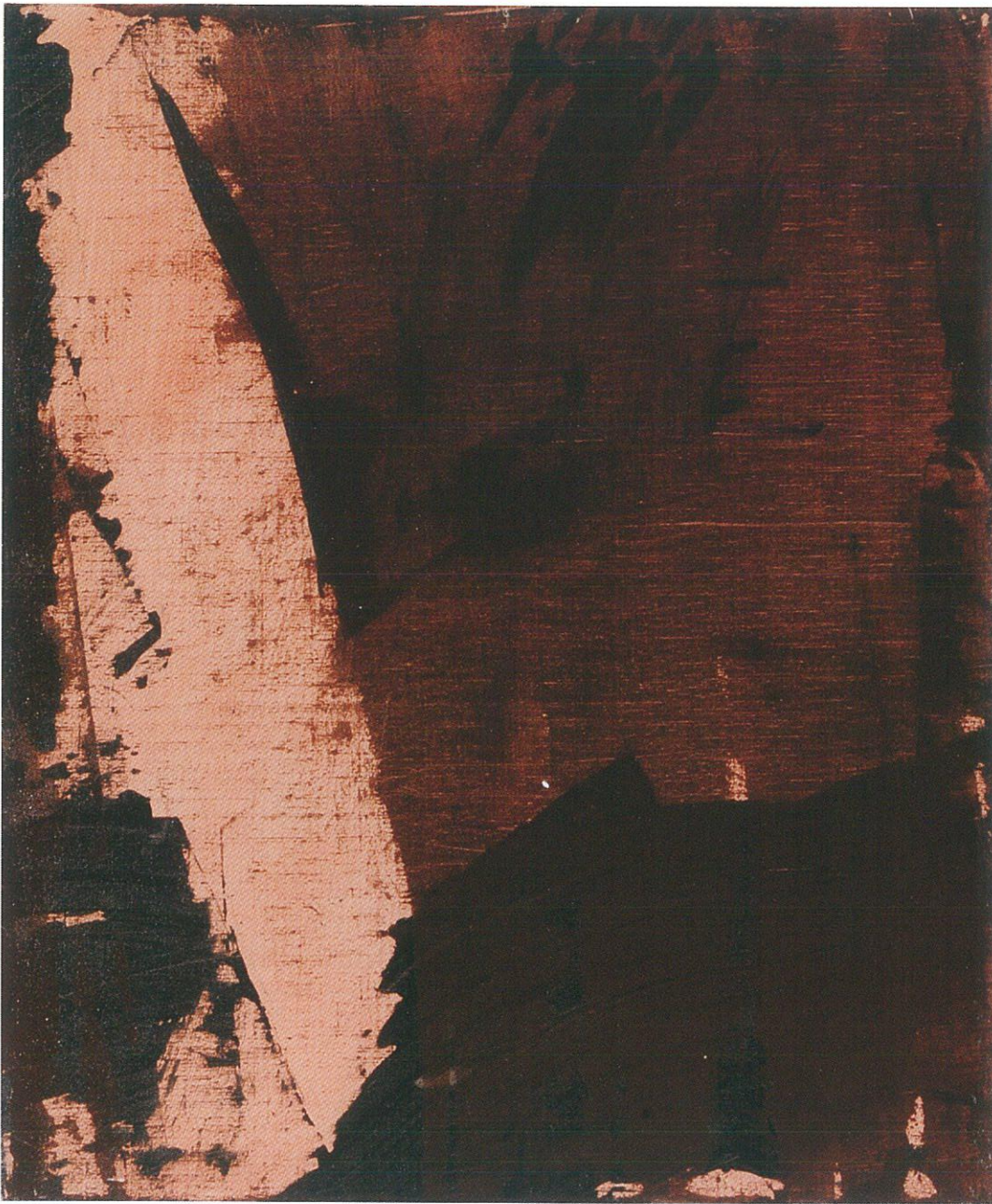
《はじまりI》 2018年 20号 キャンバスにアクリル