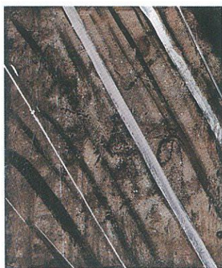
《はじまりⅤ》2018年 20号 キャンバスにアクリル