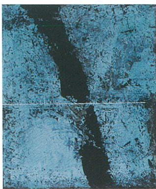
《はじまりⅢ》2018年 20号 キャンバスにアクリル