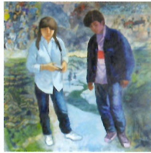
2. 追憶 山古志