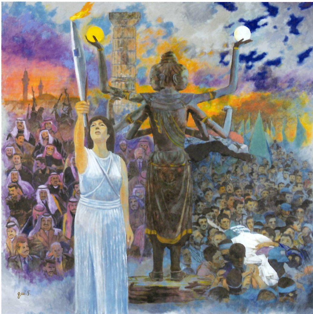
修羅にヘラの灯を S100 キャンバス 油絵 2004年