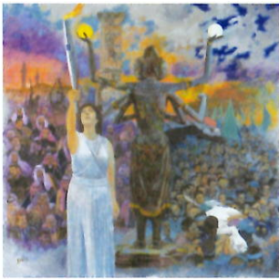
1. 修羅にヘラの灯を