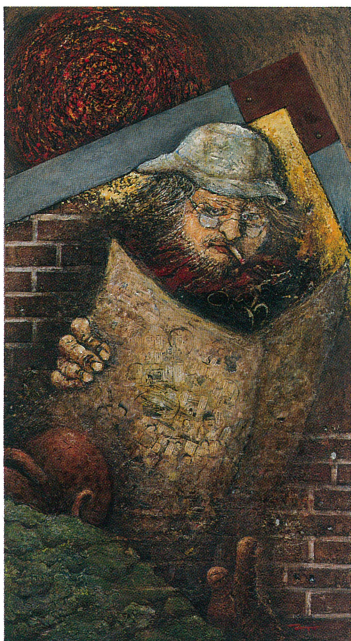
マンガを読む老人