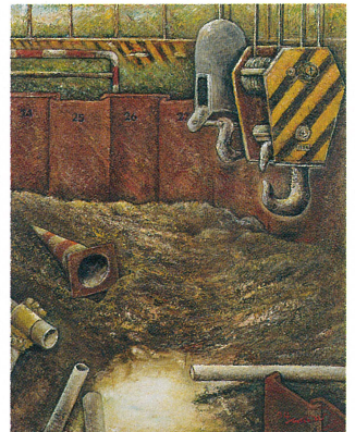
'04三郷松戸外環基礎工事