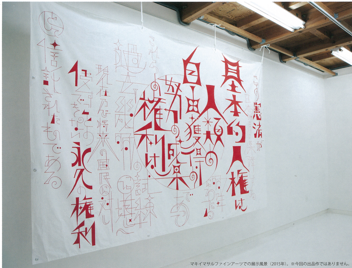
マキイマサルファインアーツでの展示風景（2015年）。※今回の出品作ではありません。