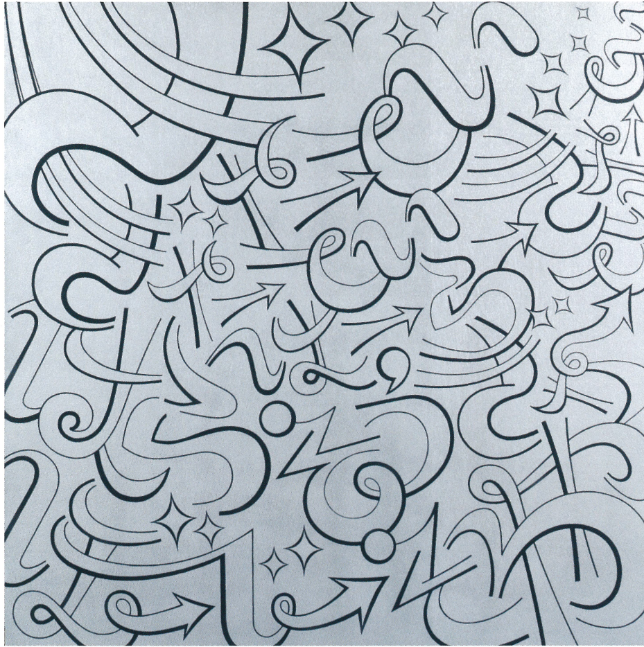
般若心経の真言 2012年