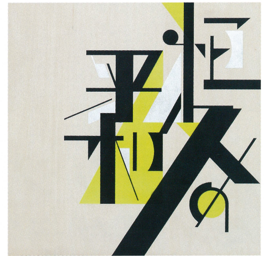
恒久の平和—日本国憲法前文から— 2015年