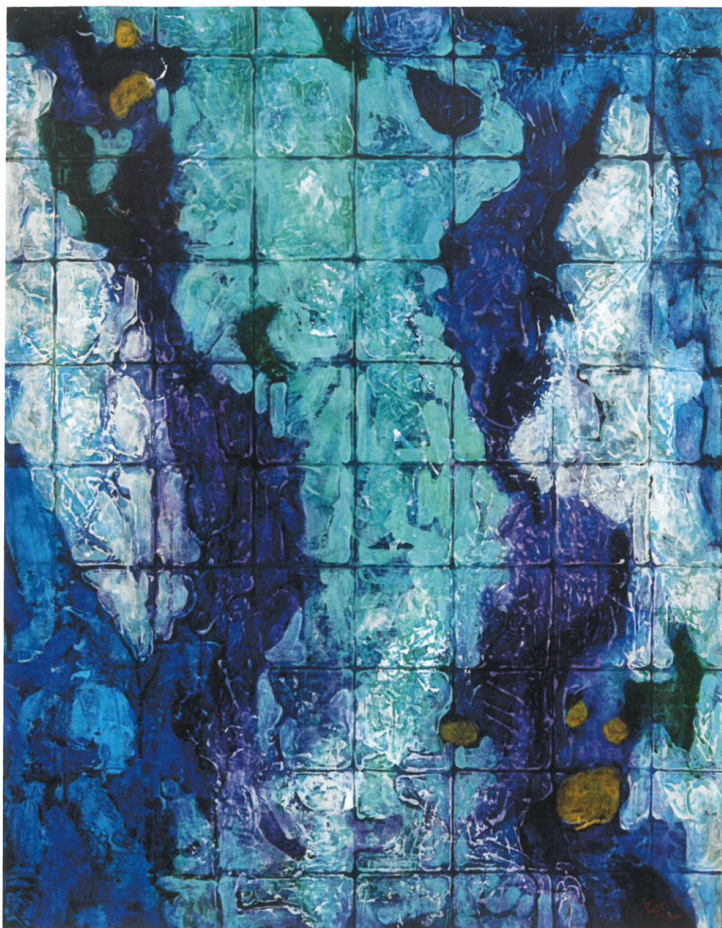
《痕跡》2020年 F30 アクリル