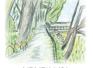
空堀と湿地を望む