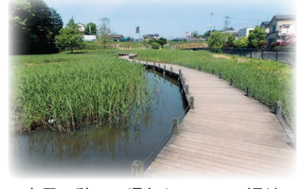
市民の憩いの場となっている湿地

出土遺物から根木内城は、戦国時代の前半に当たる15世紀後半には造られていたようです。誰が築城したかなどは、諸説あります。現在は公園となり、空堀・土塁・やぐら跡などの遺構が今も残っています。