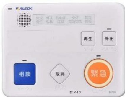
【本体緊急通報装置】