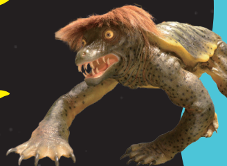
河童(国立歴史民俗博物館蔵)