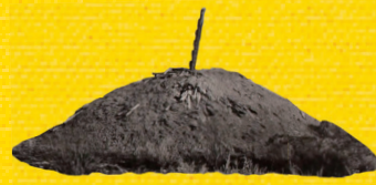
古写真・絵画パネルでみる せかいのたてあな