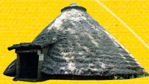
土器や建物遺構でみる まつどのたてあな